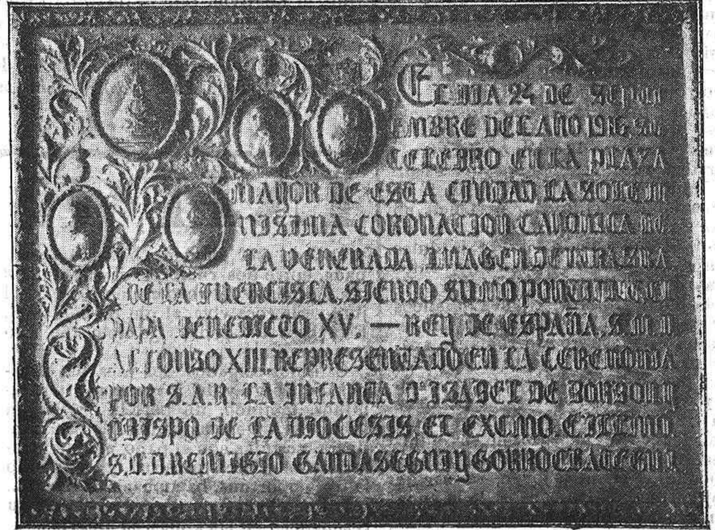
Placa de plata repujada conmemorativa de la coronación canónica de Nuestra Señora de la Fuencisla