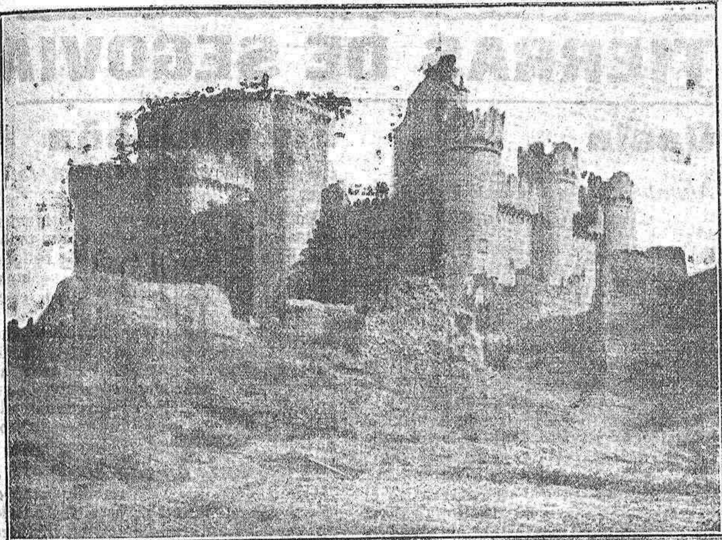
El castillo de Turégano