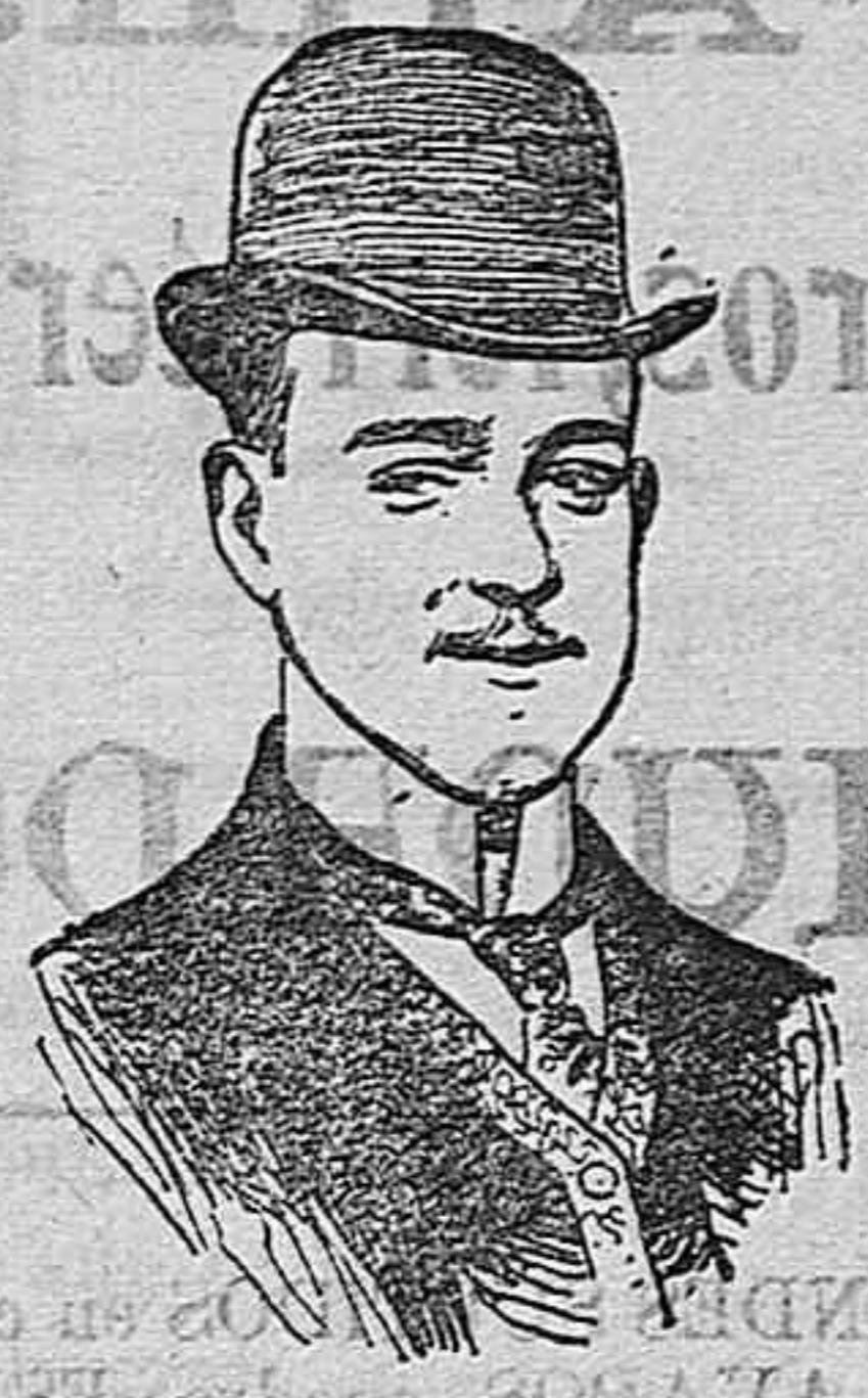
D. Manuel II de Portugal

«El anciano y los jóvenes»: Había antiguamente un país, cuyo nombre no figura más que en los mapas geográficos. Este país tenía habitantes y estos habitantes poseían un Gobierno. Un día los jóvenes de este país organizaron un mitin al aire libre y adoptaron la resolución de excluir de los asuntos gubernamentales a todas las personas que hubiesen pasado la edad de treinta años y reemplazarlas por jóvenes.