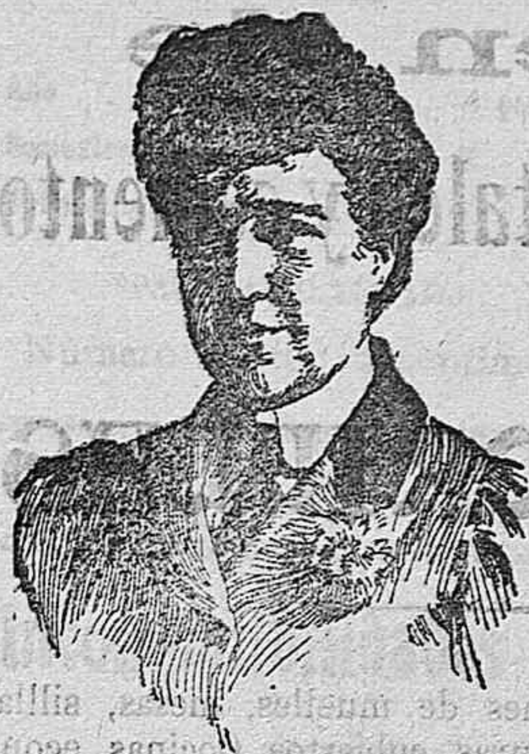
La reina Amelia