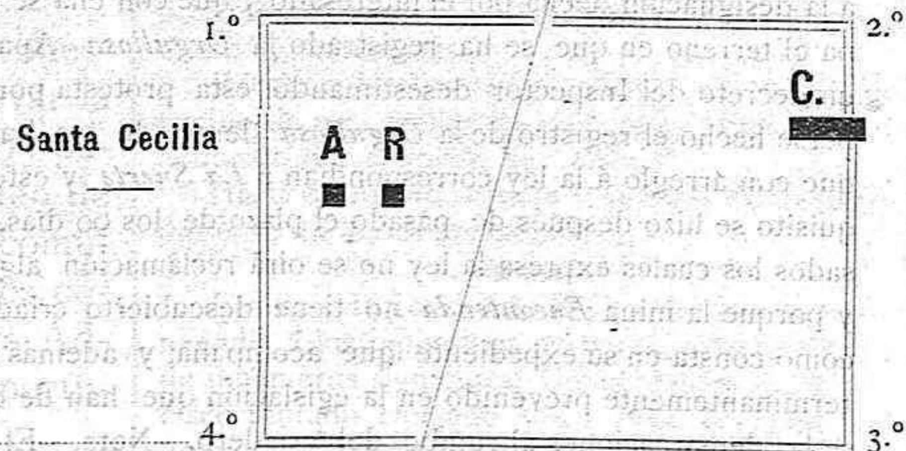
Escala en varas castellanas