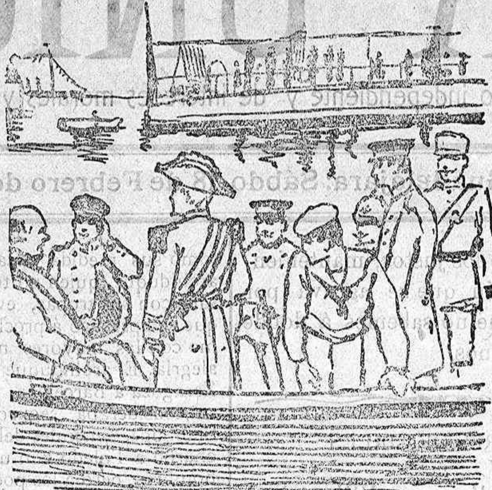
El Rey dirigiéndose al Giralda

del positivismo que domina á la sociedad contemporánea.