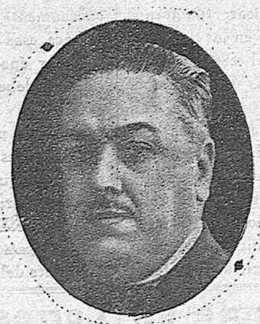
Martinez Barrios.—Republicano de abolengo. Educado en la «vieja guardia» supo hacer honor a la tradición de esa legión, marcando su separación, de sus correligionarios de siempre, la línea divisoria entre la República y la anti-República.