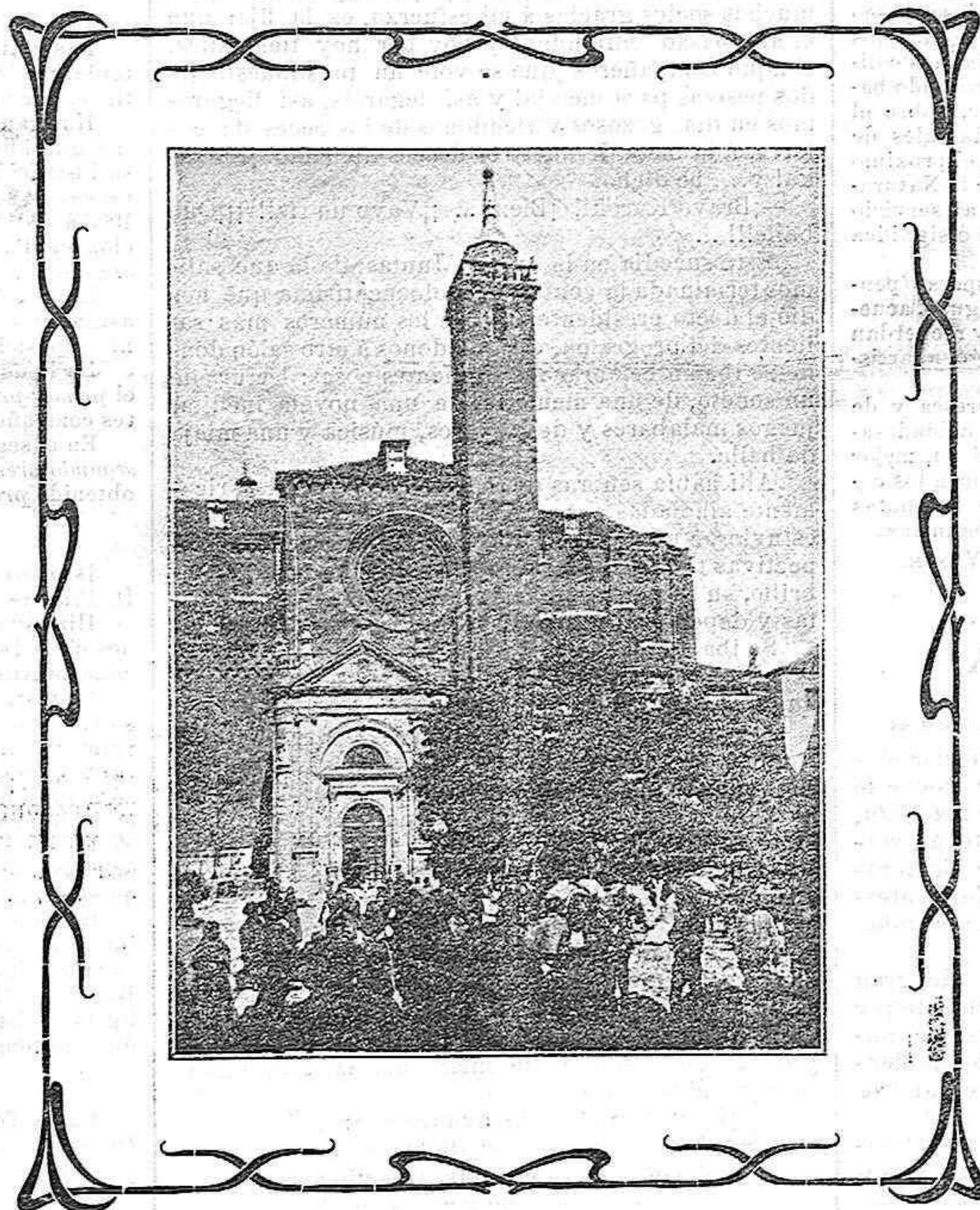
Sigüenza.—CATEDRAL.—TORRE DEL SANTÍSIMO

Esta catedral posee numerosos cálices, candeleros, bandejas, jarros, cruces y otros objetos de metales preciosos, mereciendo mencionarse un frontal de plata repujada estilo renacimiento y la custodia procesional del Corpus, copia fiel, aunque reducida, de la que desapareció durante la guerra de los franceses, conservándose su estuche, que mide más de cuatro varas de alto; pero