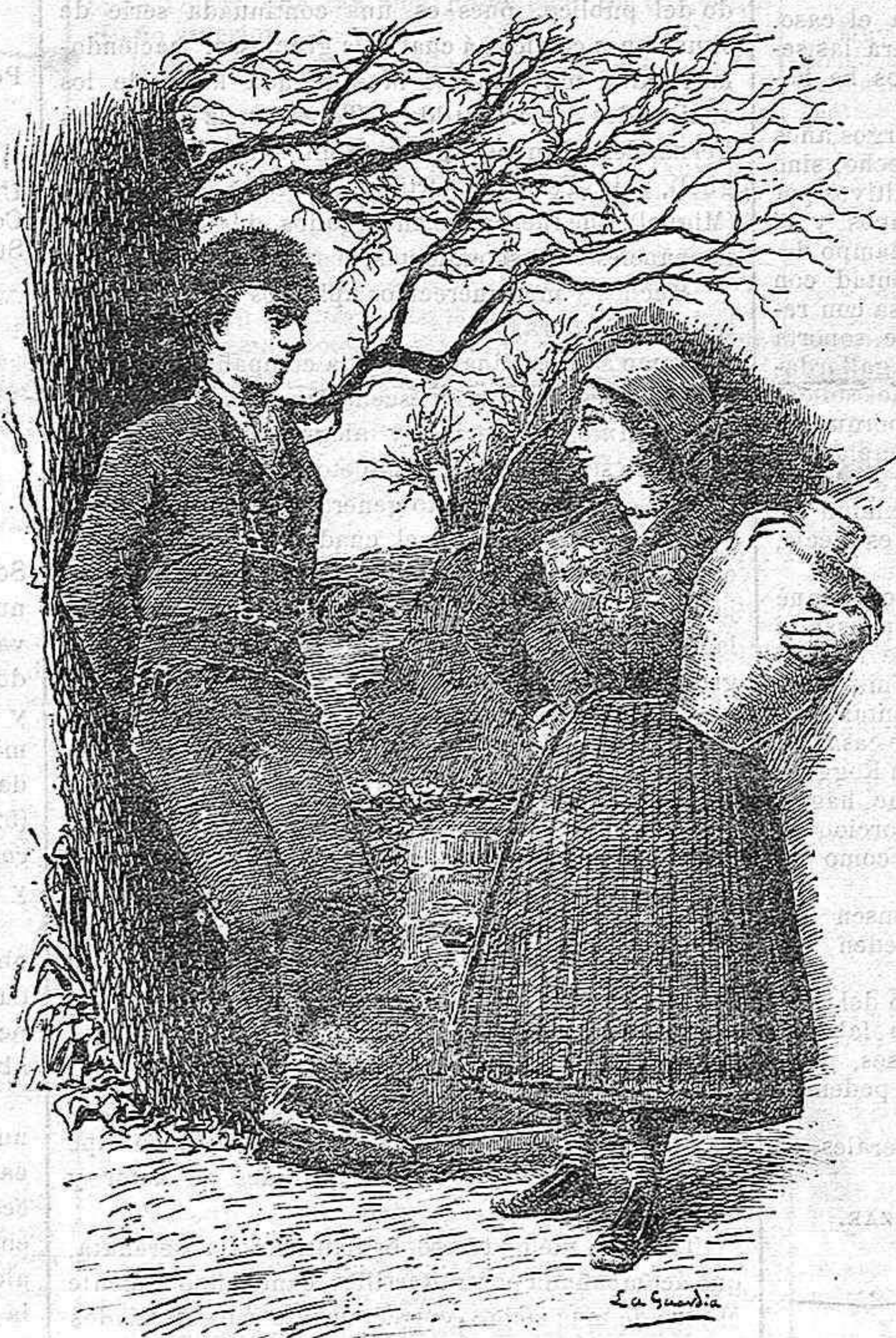
Atienza. — Los Serranos