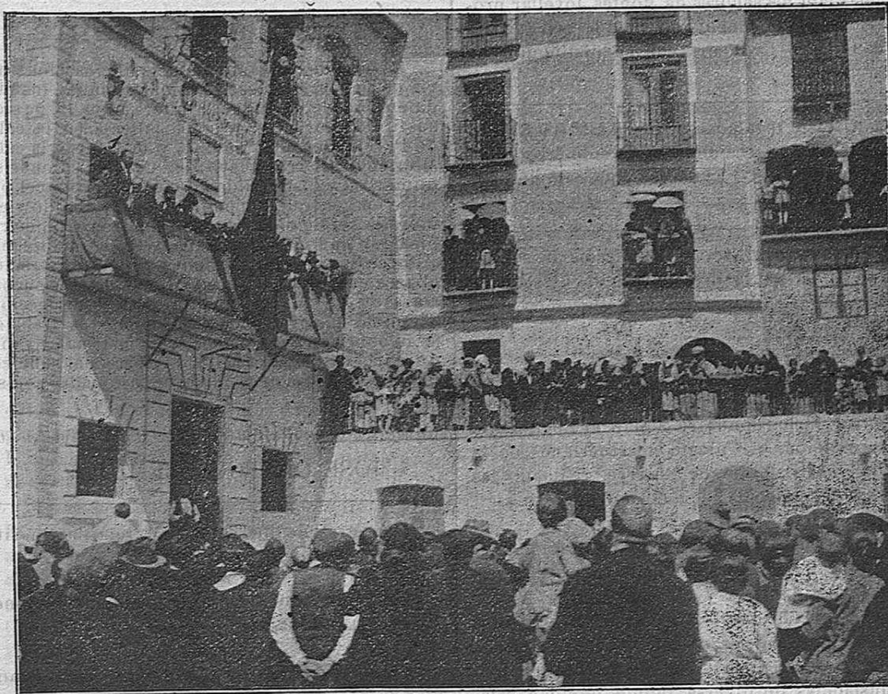
El Presidente de la Diputación Sr. García Atance (1) dirigiendo la palabra al público congregado en la Plaza Mayor, después de la entrega del bastón de mando y pergamino al Alcalde.

proyecto que obtuvo favorable acogida en la Diputación de Teruel, constituyente con la nuestra de la Mancomunidad en él esbozada, y duradera repercusión en los intereses de comarcas afines cual lo demuestran reiteradas solicitudes formuladas por una importantísima villa aragonesa.