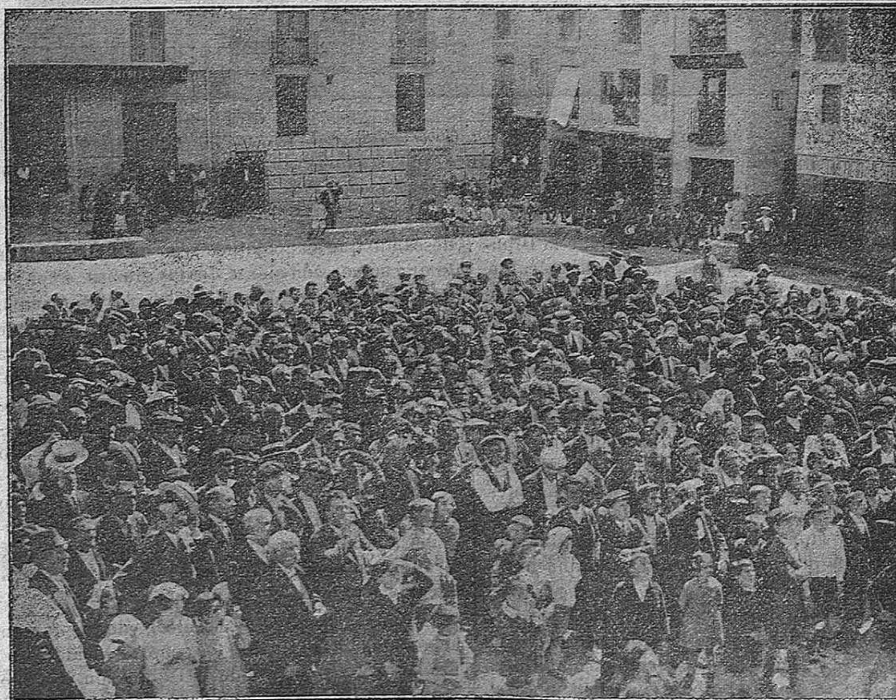
El público congregado en la plaza Mayor vitoreando al Alcalde, Gobernador y Presidente de la Diputación, al salir a los balcones de las Casas Consistoriales, después de la entrega del bastón y pergamino al primero.