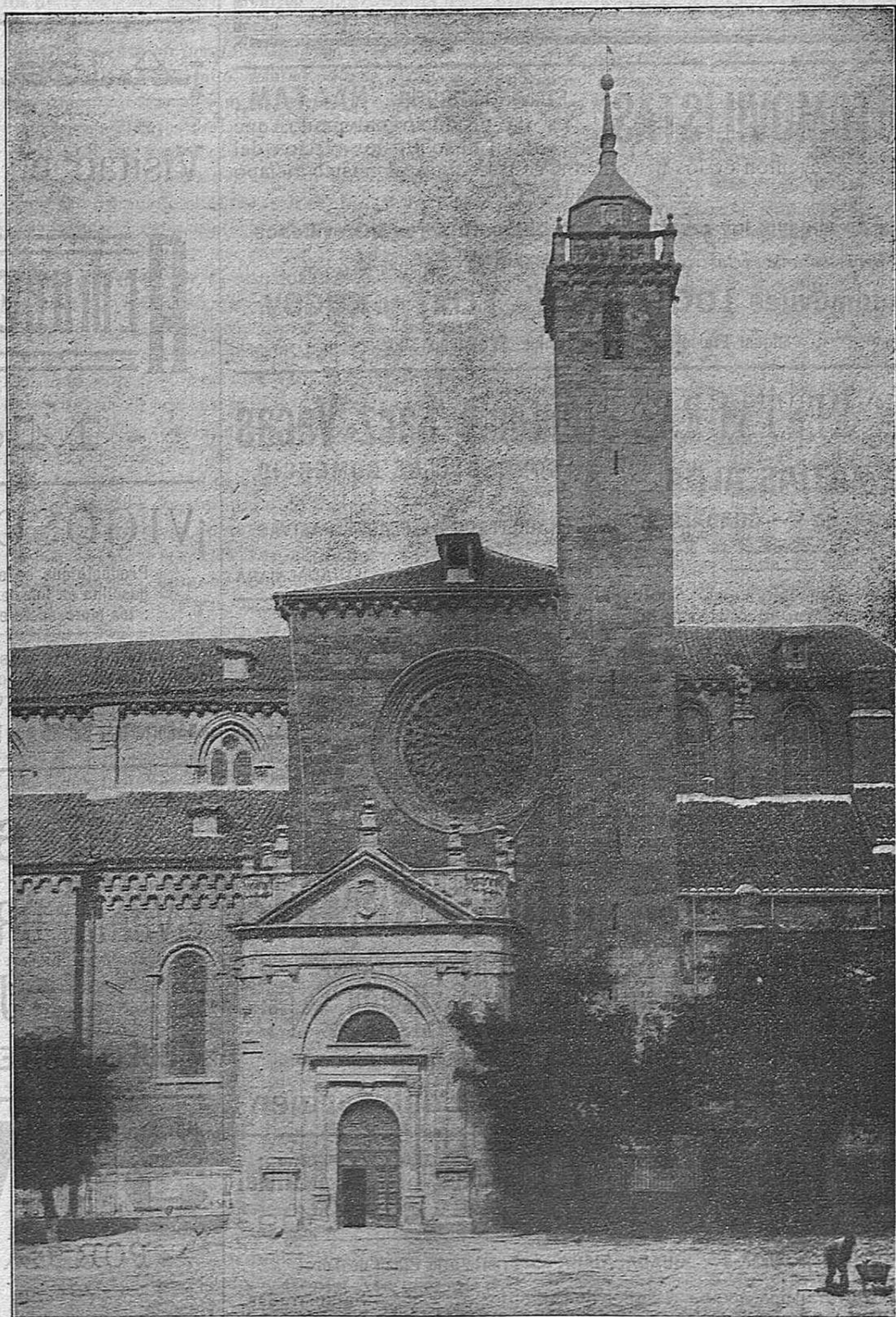
:- La torre del Santísimo :-

Fué en otro tiempo destinada, a modo de alminar o atalaya, a prever toda sorpresa del enemigo. Construida a fines del siglo XIII o principios del XIV, fué transformada poco después en campanario. En 1504 un rayo destruyó el chapitel y hubo que rehacerlo; en 1591 sufrió nueva restauración, acaso demasiado libre; en el siguiente siglo fué trasladado su antiguo reloj a otra torre y en el XVIII recibió la reforma definitiva colocando en los matacanes algo que había de armonizar con el conjunto como la postiza portada.—R.