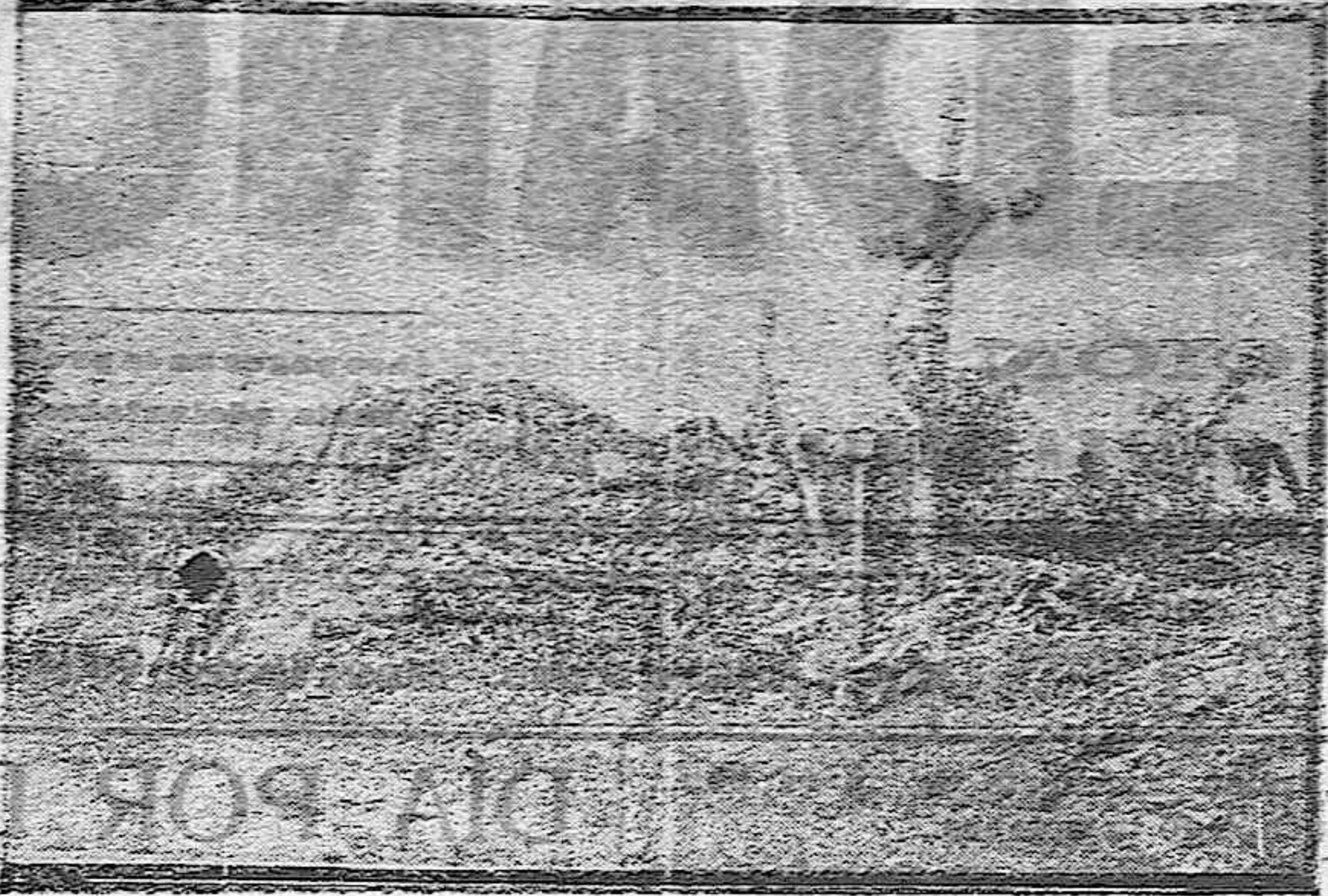
El calvario en las ruinas

Pasaron los Ejércitos asolando los campos, hollados con su planta y maltratando el terreno en que los hombres sembraron el alimento necesario para los pueblos. Hendidas en el terreno, producidas por el peso de los cañones, resquebrajadas en la tierra, que hicieron cascotes de metralla candente, en su caída, árboles tronchados, caseríos derruidos... Un montón de ruinas... Sobre esas resacas de una lucha encarnizada, en aquel mismo sitio en que quedaron sin vida muchos hombres, que en su última hora tuvieron una frase solemne en recuerdo de su madre carnal o de su madre Patria, los supervivientes han enclavado una Cruz con la Imagen del Redentor del Mundo.