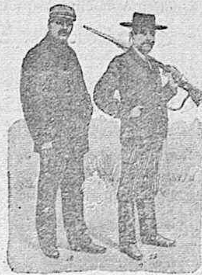
Figura 12.—Chaquetón mayorquín, sin forros. En azul, café, gris claro y gris obscuro, de mucho abrigo, 30 pesetas.

DE NUESTRO CATÁLOGO DE PRENDAS DE CAZA, CAMPO Y SPORT MOISÉS SANCHA CRUZ, 12, MADRID