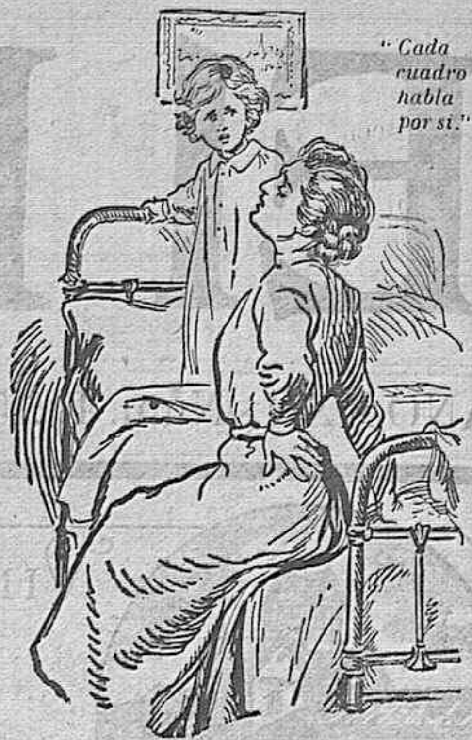
«Cada cuadro habla por sí.»

Hay mujeres que creen que sus dolores de espalda, latidos en la sien, vahidos, punzadas reumáticas, palpitación del corazón, y extremo cansancio antes de terminar el día, es cosa muy natural de su sexo y nunca sospechan que sus achaques se originen de los riñones.