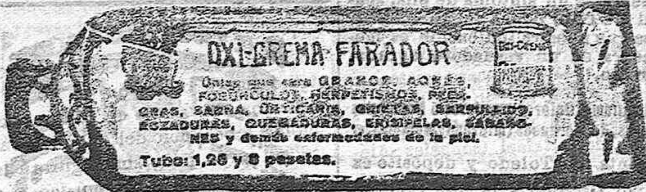
De venta en, todas las Farmacias y Droguerías

Acidias, vómitos, exceso de bilis, ardor de estómago, dispepsia flatulenta, se cura rápidamente tomando después de las comidas una cucharadita de Magnesil, Dr. Gomis. De venta: en todas las Farmacias y Droguerías.