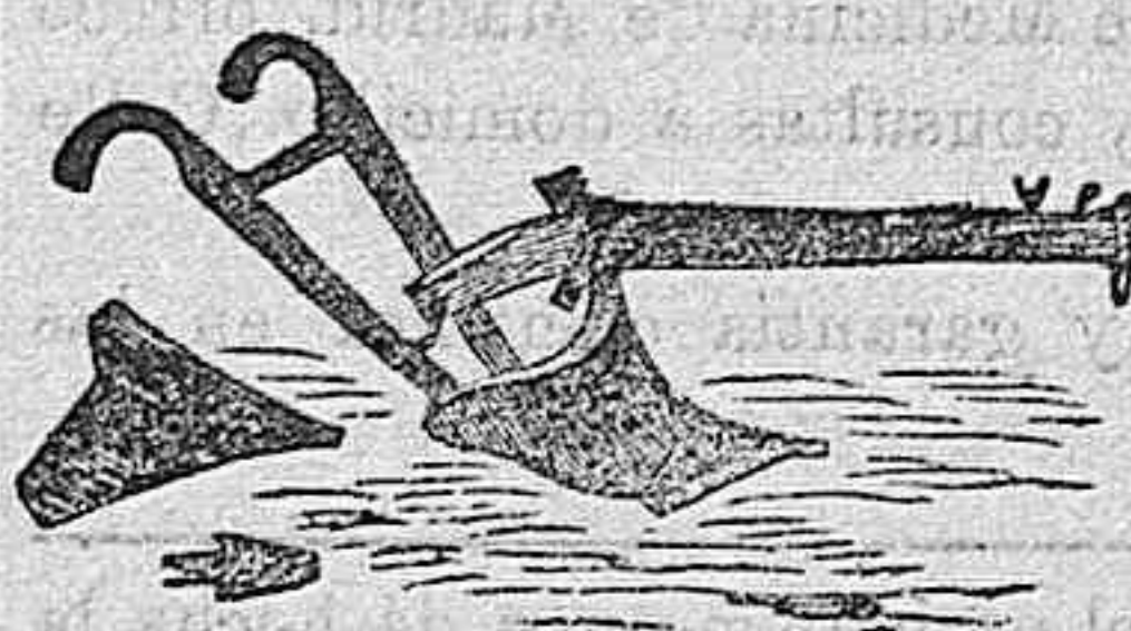
Arado de vertedera SIMPLEX

Alcalá, 52, MADRID—Sucursal Avenida de Alfonso XII, 16, VALLADOLID La mejor maquinaria agrícola é industrial.