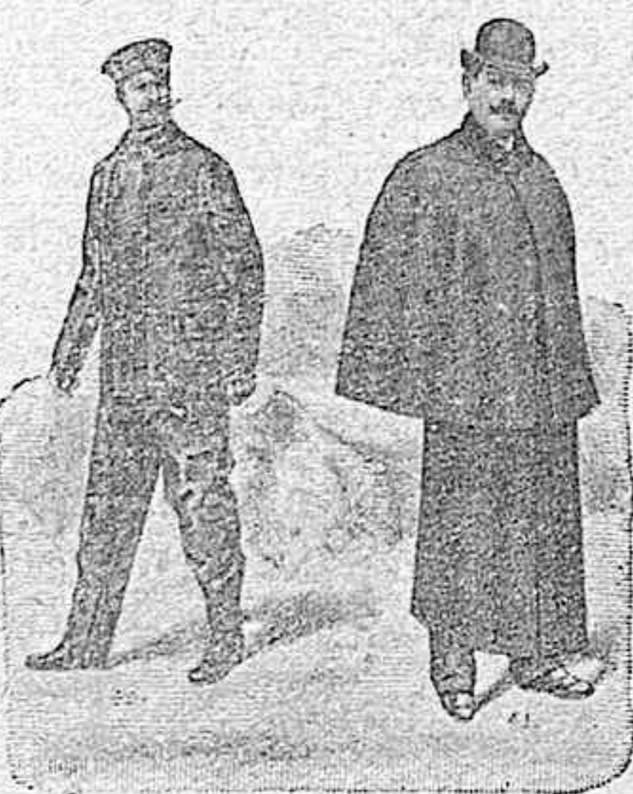
Figura 40.—Traje de piel negra, cuello de paño, forrado todo en franela, 100 pesetas. Solo la americana, 60 pesetas.

CATÁLOGO DE PRENDAS PARA CAZA, CAMPO, PLAYA Y VIAJE DE LA CASA MOISÉS SANCHA CRUZ, 12, MADRID