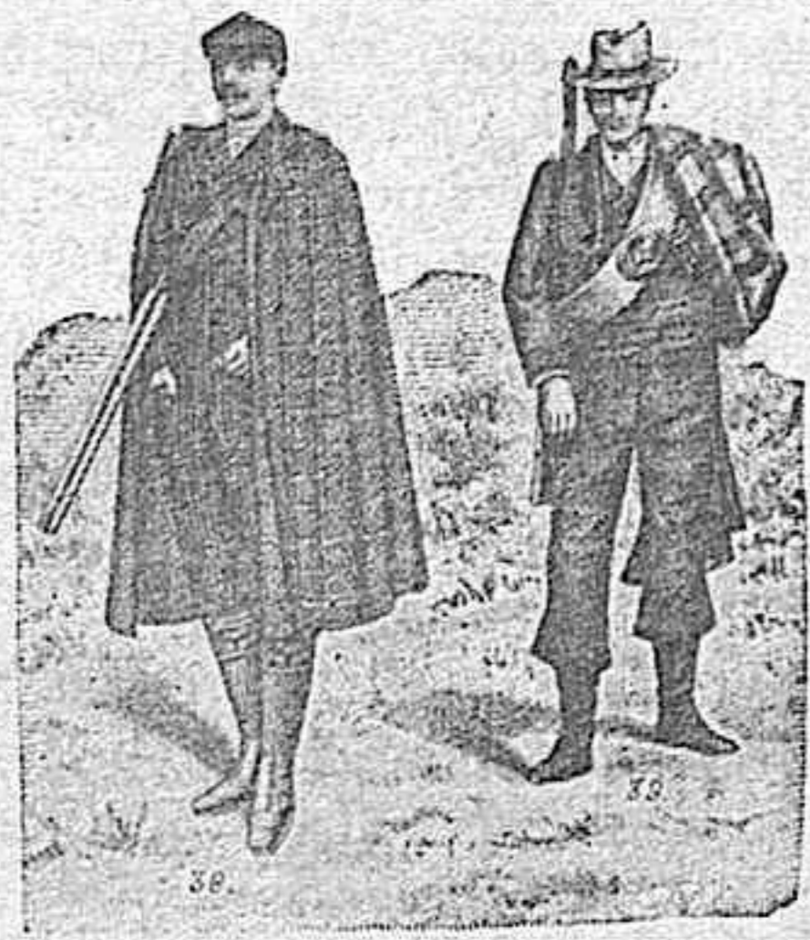
Figura 38. —Capota, con capucha de paño, impermeabilizado, á cuadros ó en colores lisos, muy práctica para cazar, en mano se reduce á poco peso y volumen, 60 pesetas. De impermeable más corta, en negro ó color, 35 pesetas. Figura 39. —Traje para guardas jurados, sólida confección, en buen paño, colores adecuados, con vivos de color y botones dorados, 70 pesetas. Capote para ídem, 30 pesetas.