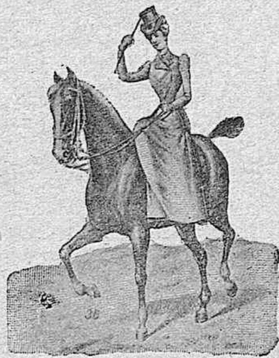
Figura 36.—Traje de amazona, para cacerías ó paseo, cuerpo y falda, 200 pesetas; pantalón, 30 pesetas.