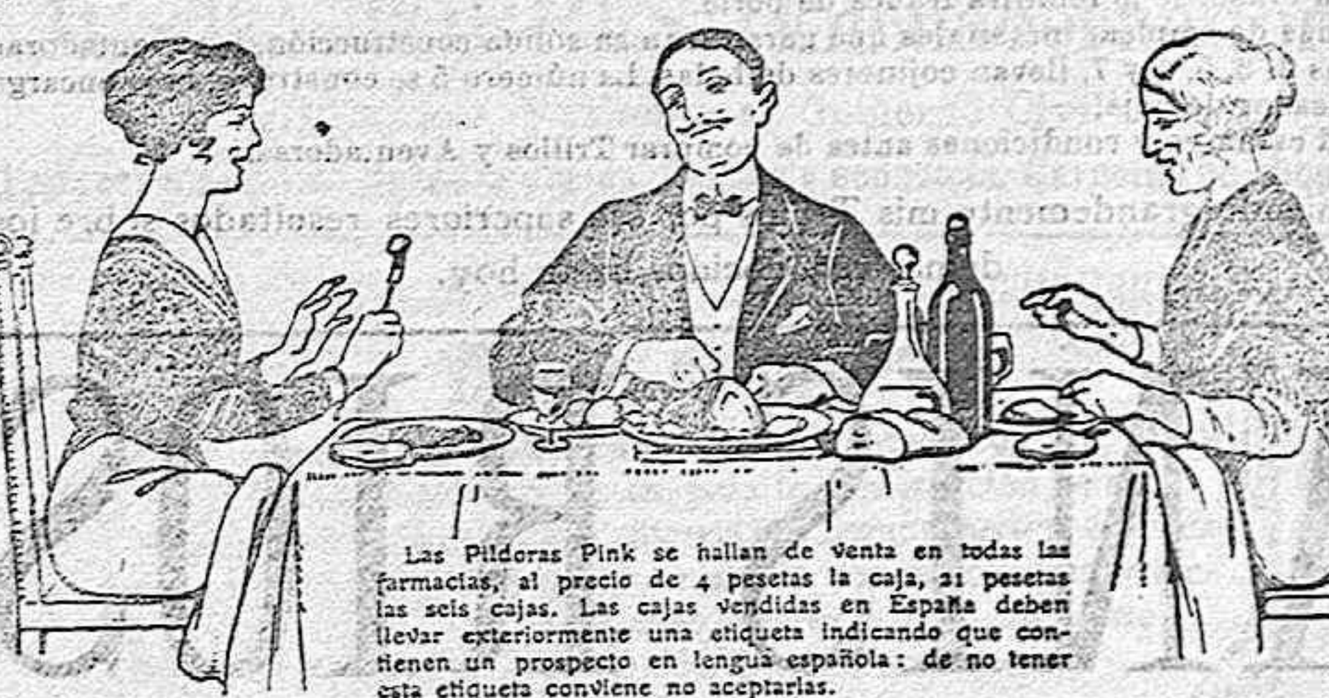
Las Pildoras Pink se hallan de venta en todas las farmacias, al precio de 4 pesetas la caja, 21 pesetas las seis cajas. Las cajas vendidas en España deben llevar exteriormente una etiqueta indicando que contienen un prospecto en lengua española: de no tener esta etiqueta conviene no aceptarlas.

taciones. Despierto, con su razón natural completa, no cree al Gobierno tan torpe que sea capaz de hacer tarde una cosa que podría perjudicarle y que perjudicaría también a sus amigos.