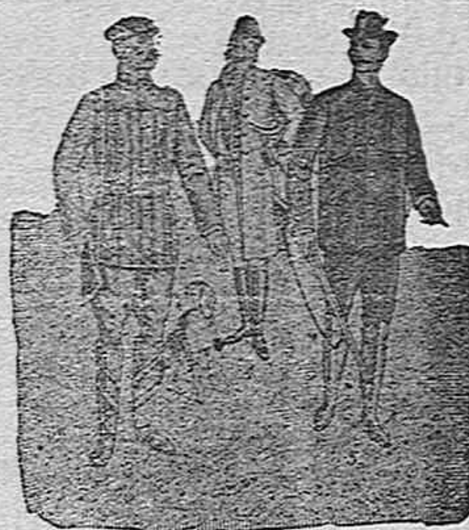
Figura núm. 1. Traje pana del país, en liso, á elegir en colores café, gris, azul, negro ó bronce, forros de abrigo, 80 pesetas. En pana inglesa ó francesa, 135 pesetas.—Figura núm. 2. Traje de pana, bordón ancha, en todos los colores que son de uso, cou canesú en la espalda y delanteros, botones adecuados, con relieves alegóricos; en pana catalana, 70 pesetas, en pana inglesa 130 pesetas.

De nuestro Catálogo de prendas de caza, campo y sport.