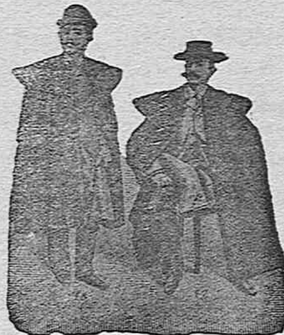
Figura núm. 44. Traje de americana cruzada, de gran vestir, al último figurin inglés, dibujos los más nuevos, en negro ó azul, en cheviot, armur ó vicuña, á 60, 80, 100 y 120.—Figura núm. 45. Traje de americana á cuadros ó mezclas, infinidad de dibujos de alta novedad, á 50, 75, 90 y 100 pesetas.

Figura núm. 46. Capa madrileña, corte y estilo especial de la casa, á 50, 70, 90, 110 y 150 pesetas.—Figura núm. 47. Capa bordada á mano, en paños finos de Béjar, colores garantizados, en azul, verde ó café, dibujos diferentes desde 150, 200, 250 á 400 pesetas.