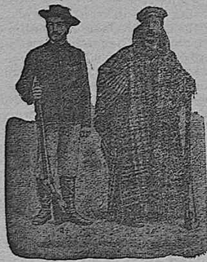
Figura núm. 22. Chaquetón de dos filas, solapas grandes, acolchado, ribetes de paño, para más duración, en edredón azul, negro ó café, 60 pesetas.— Figura núm. 23. Prusiana, montañac inglés, de gran lujo y mucho abrigo, va ribeteada de fino paño, 80 pesetas. Forrada en pieles de Holanda: en negra 140 pesetas. En gris ó marrón, 180 pesetas. En rasé, imitación á nutria, 225 pesetas.

De nuestro Catálogo de prendas de caza, campo y sport.