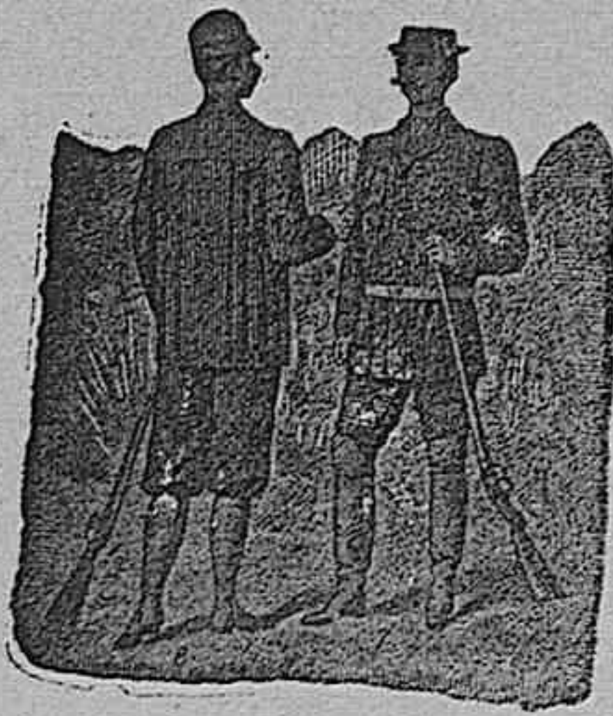
Figura núm. 6. Traje de patén á rayas, lleva la americana seis bolsillos, cuello á la marinera, pantalón bombacho con puño, 80 pesetas.—Figura núm. 7. Traje de pana, tableado, con cinturón de cuero é iniciales grabadas, pantalón largo que se puede poner polaina, en pana del país, 75 pesetas, en pana alemana, 120 y en inglesa ó francesa, 135 pesetas.

PIDASE EL CATALOGO ILUSTRADO QUE SE DA GRATIS