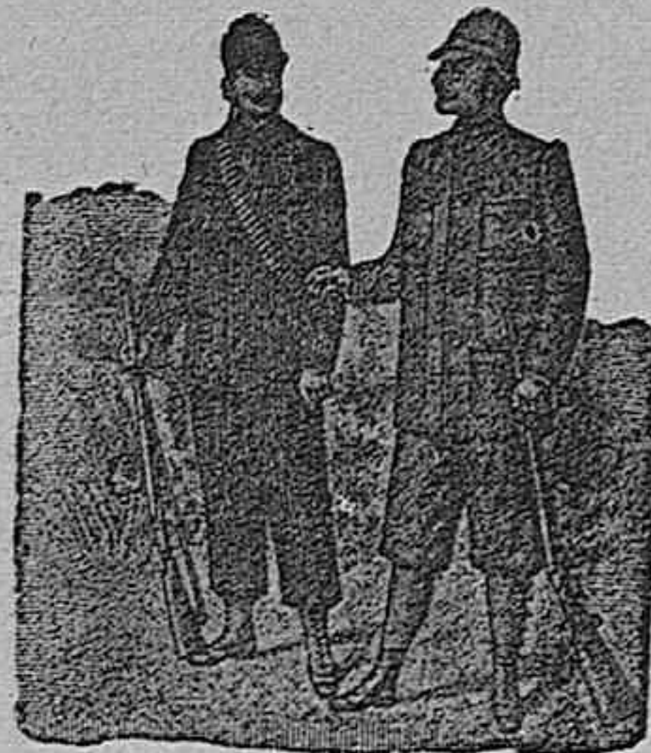
Figura núm. 8. Traje de pana austriaca, muy delgada, con salpicado blanco ó nevado, bordón menudo, pantalón forma calzona, diferentes colores, 100 pesetas.—Figura núm. 9. Traje de paño cuero, en colores lisos, lleva el chaleco espalda y mangas del mismo paño, la americana no las lleva, el pantalón largo ó con puño, 90 pesetas.

De nuestro Catálogo de prendas de caza, campo y sport.