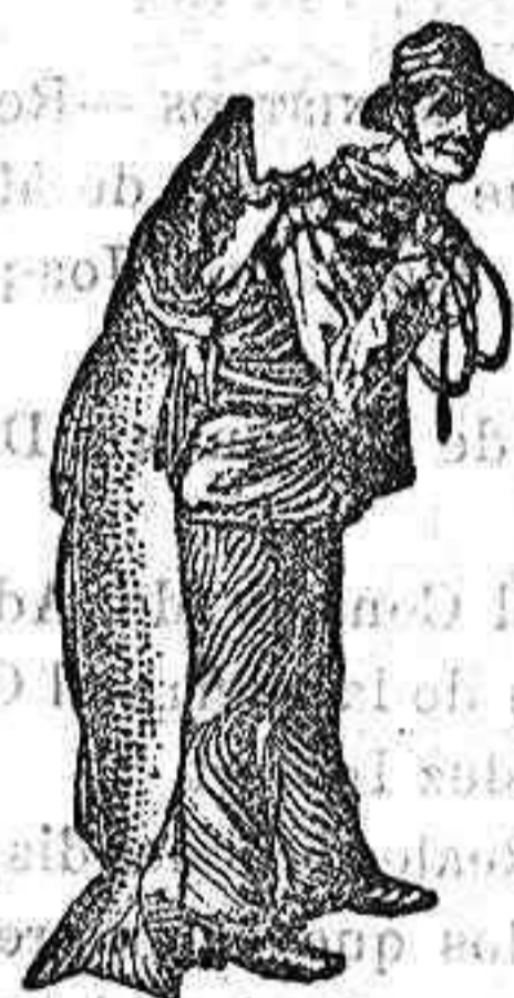
Obténase siempre la Emulsión con esta marca "El Pescador", marca del procedimiento Scott!

Cualquiera que sea el tiempo que ha estado V. tosiendo, la emulsión de SCOTT le cortará la tos. Nada le curará una tos con tanta rapidez y tan permanentemente como la de SCOTT. La Emulsión SCOTT es única en su clase. Supera de mucho a todas las emulsiones similares, en poder curativo. Compre esas y masticará su dinero. Compre la de SCOTT y se curará Ud. Ninguna otra emulsión posee tan altas recomendaciones como la de SCOTT. En todas las droguerías y farmacias.