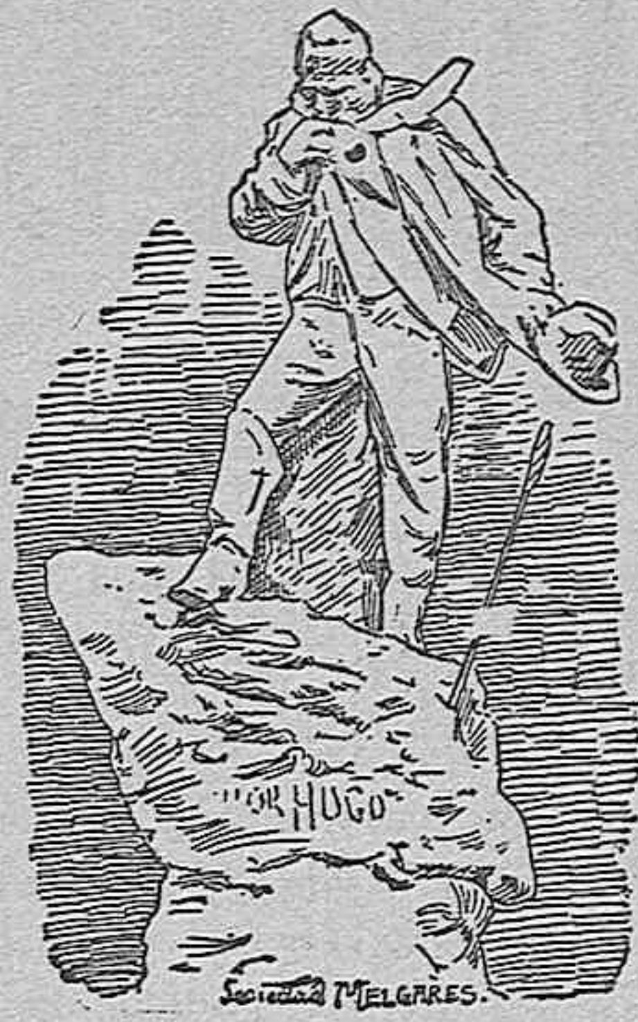
Estatua á Victor Hugo.