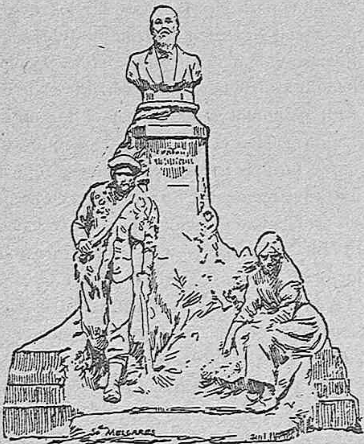
Monumento á Fernand Lafargue.

La obra se ha hecho con el dinero de todos los bordeleses, ricos y pobres.