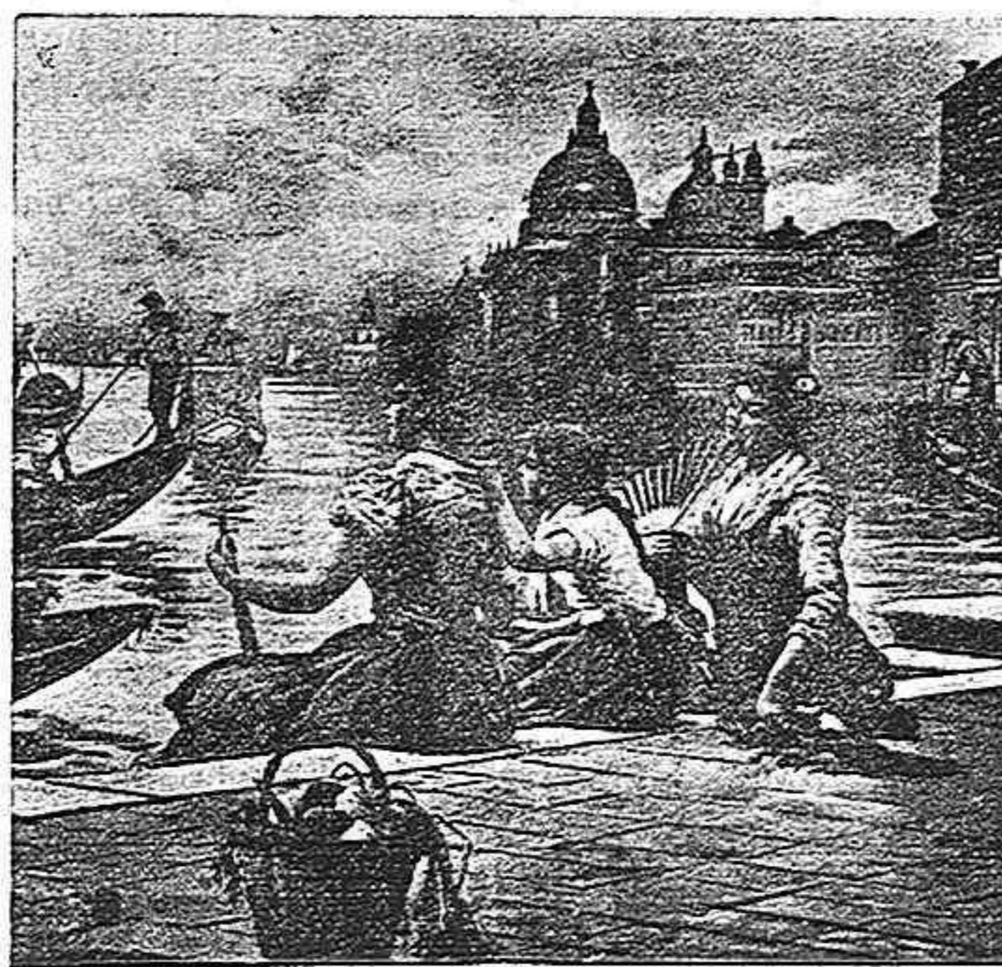
Vista de Venecia.

En un periódico de la Corte leo que se cursan en Palacio, por orden del Rey, cerca de 800