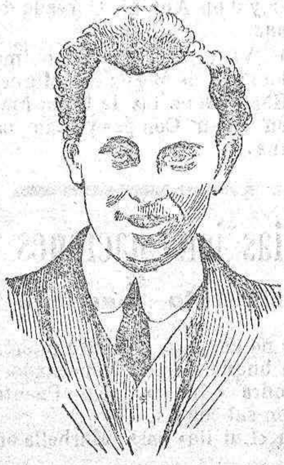
El teniente inglés Avoker, el primer piloto aviador que ha intentado atravesar el Atlántico sin conseguirlo, por haberse extraviado y caído al mar.