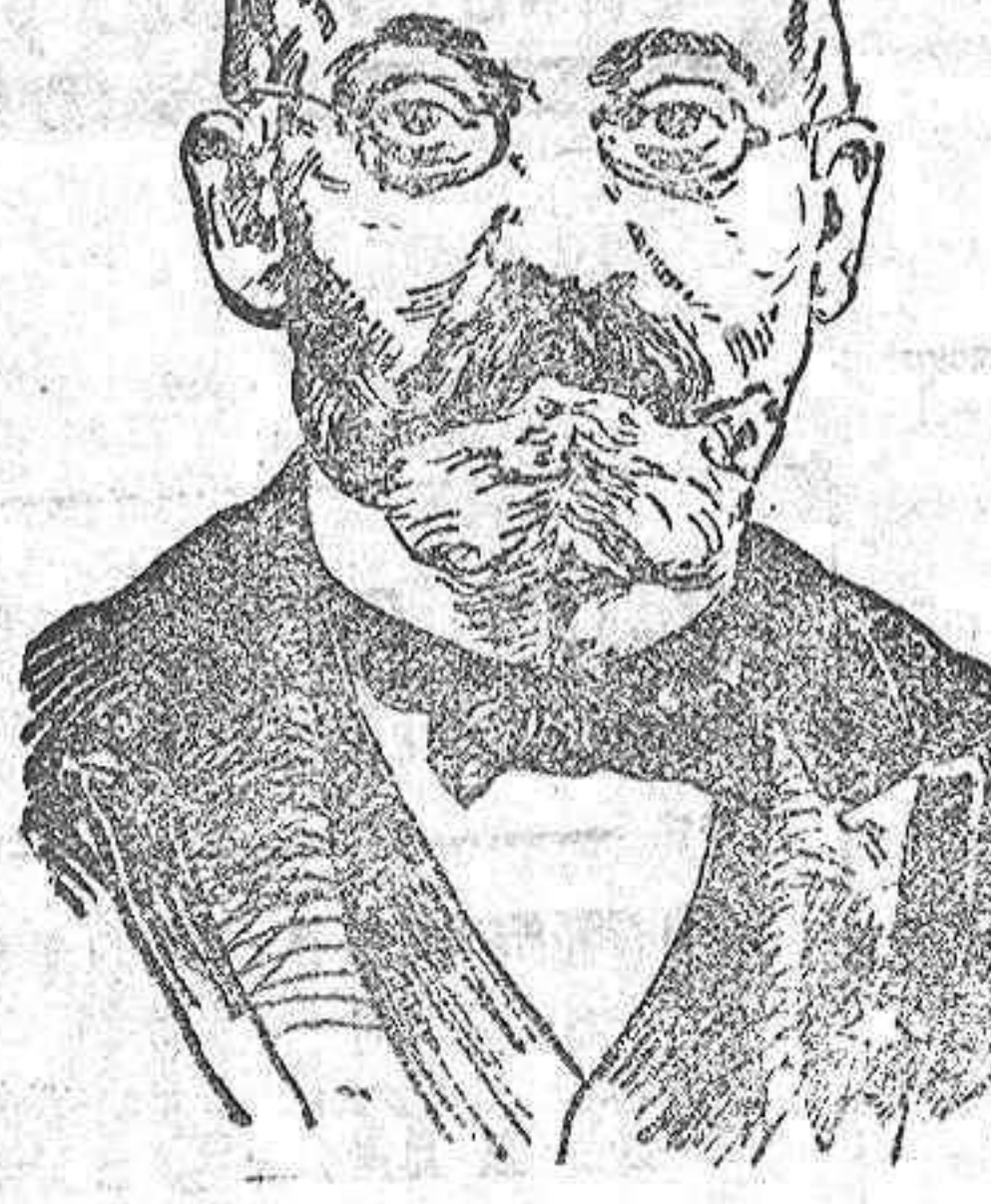
Mr. Venicelos, ex-presidente del Consejo de ministros de Grecia que ha llegado a Marsella, siendo muy aclamado por la multitud.

Ayer en la Plaza de Abastos se podía comprobar lo que decimos. Hubo pescado procedente de Requena y Blerma, en más cantidad que días anteriores.