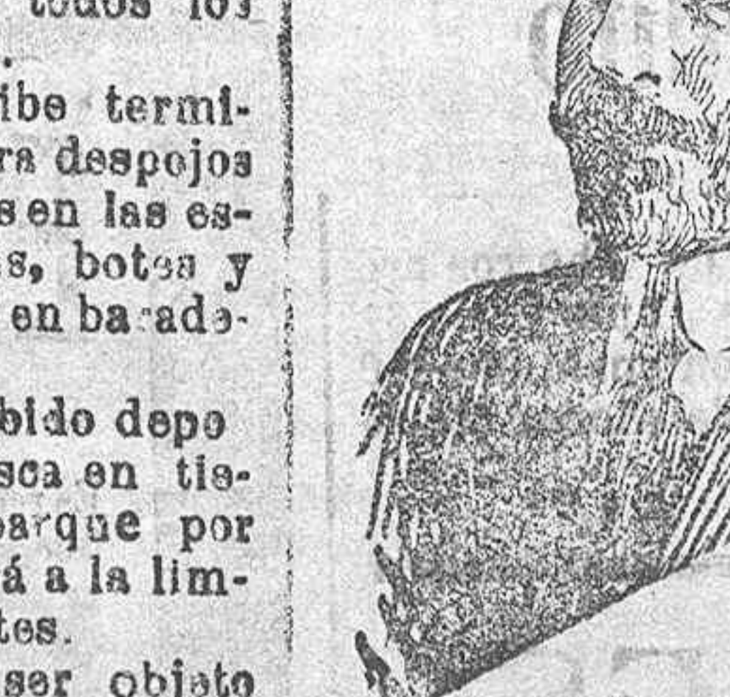
Don Ignacio Suarez Somonte, distinguido catedrático, nombrado últimamente Rector del Instituto del Cardenal Cisneros.

legislada, constató que celebraría una conferencia con el señor Olivares para ver la forma de poder solucionar el asunto.