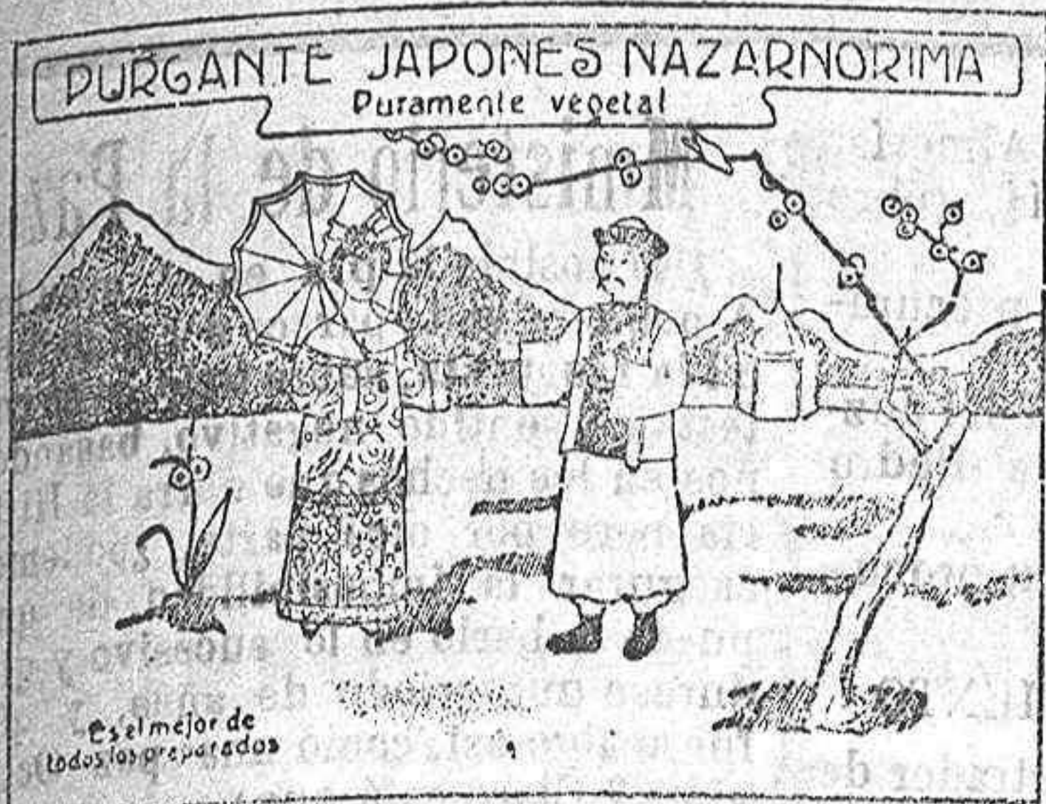
Sello Japonés "Gimen"

Puede tomarse también tal como está preparado, sin disolverlo en liquido ninguno; basta echárselo a la boca y tomar un sorbo de agua, tila, etc., etc., etc., resultando en este caso de sabor riquísimo. Solo cuesta 25 céntimos.