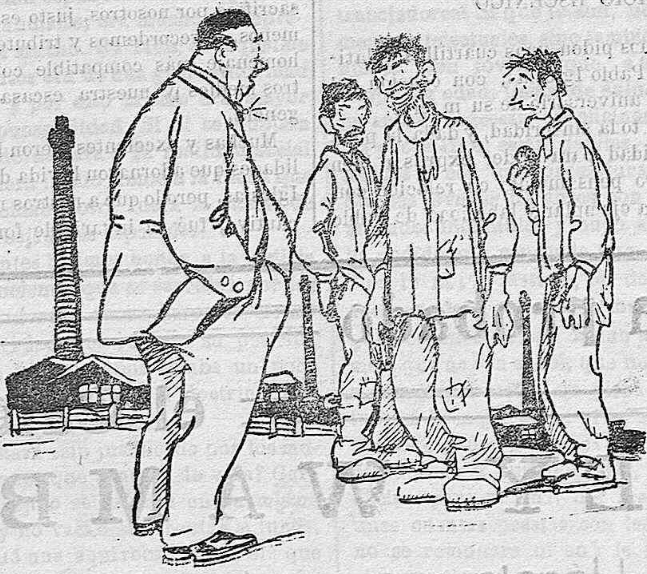
El patrono.—Si no aceptáis la rebaja, yo no podré vivir. La Comisión.—¿Quiere usted que cambemos una tempordita?

Pablo Iglesias quizá fué en España, y fuera de España, el hombre único. Pablo Iglesias pudo serlo todo y todo lo despreció, y con su alma noble y amorosa consagró todo su ser al único amor de sus amores: a desbrozar el camino espinoso de la redención de los humildes, de la emancipación de los trabajadores.