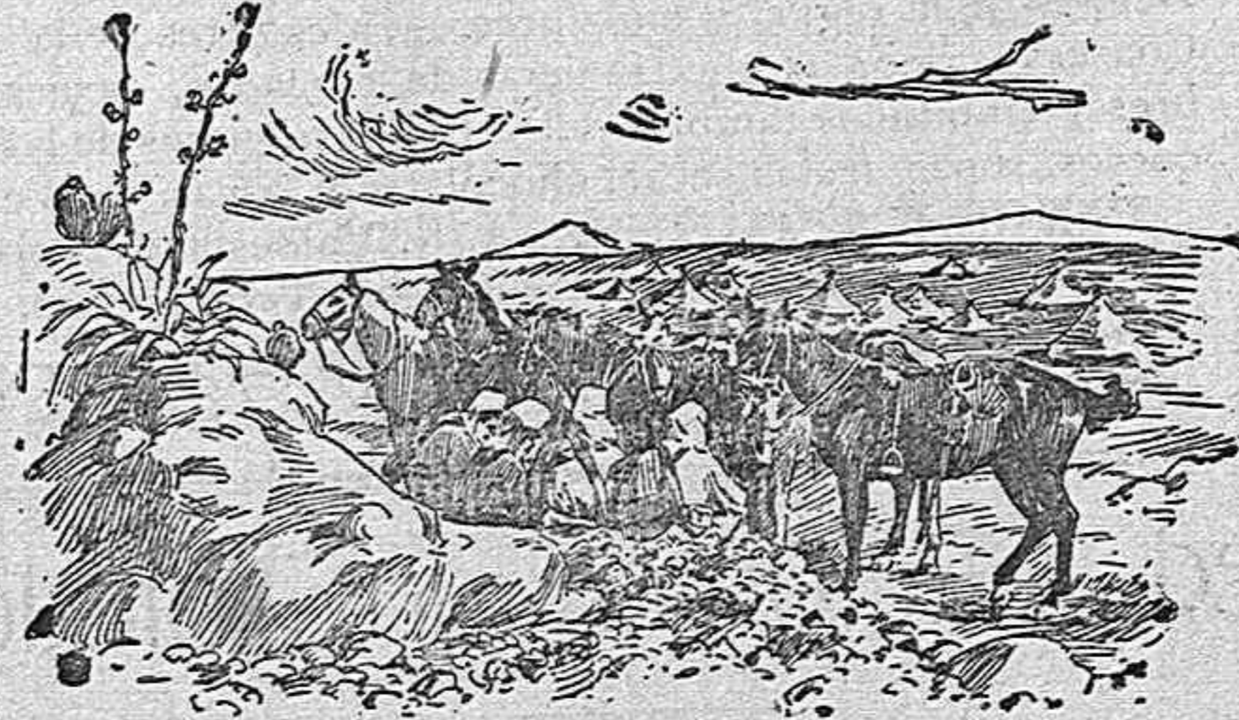
Una avanzada de caballería.

Los corresponsales que desde Melilla escriben la crónica de la guerra, vienen hablando de la intervención efectiva que en ella ha tenido lo imprevisto, lo que no se creía, lo que no se esperaba. Con tales antecedentes es presumible que ese factor, de lo que no se esperaba, vuelva á presentarse en el desarrollo de las futuras operaciones, y para evitarlo,