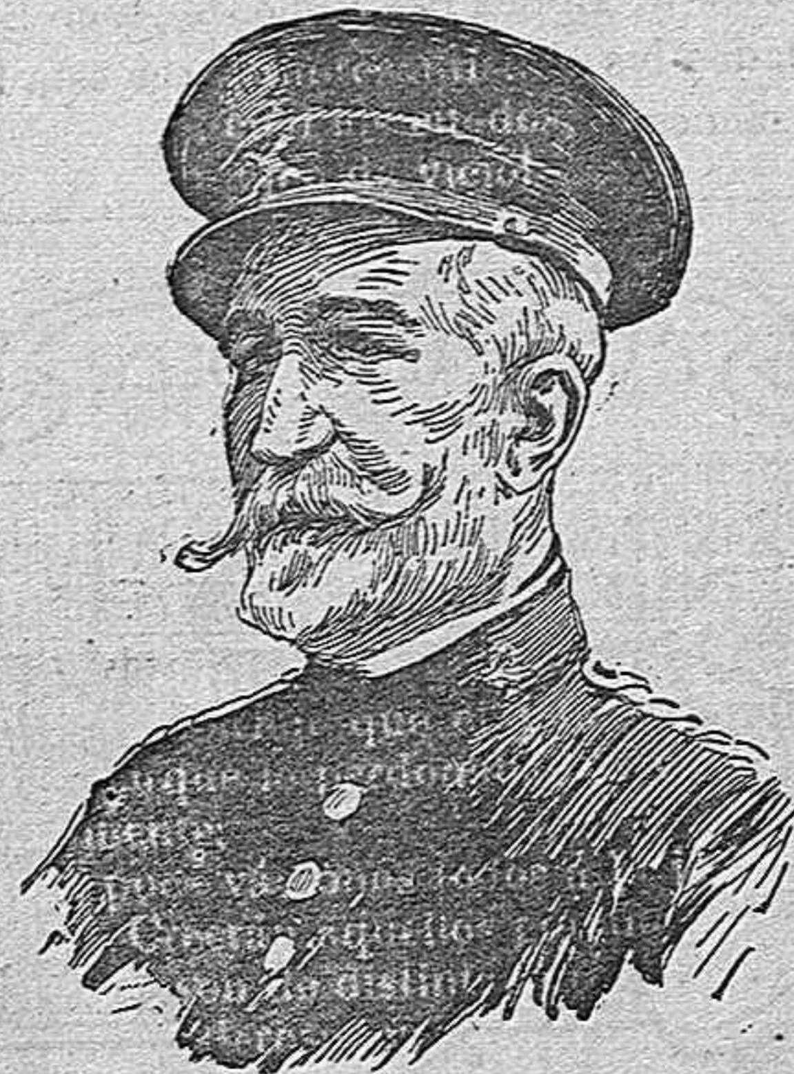
El general Arizon, gobernador de Melilla.

Así la resistencia rifeña será más fácilmente vencida, así aquel enemigo que endiosa la fuerza se someterá primero á la de nuestros fuertes y cañones; así aquel territorio, en el que hasta las piedras parece que hacen causa común con sus pobladores contra nosotros, quedaría prontamente sometido; así, en fin,