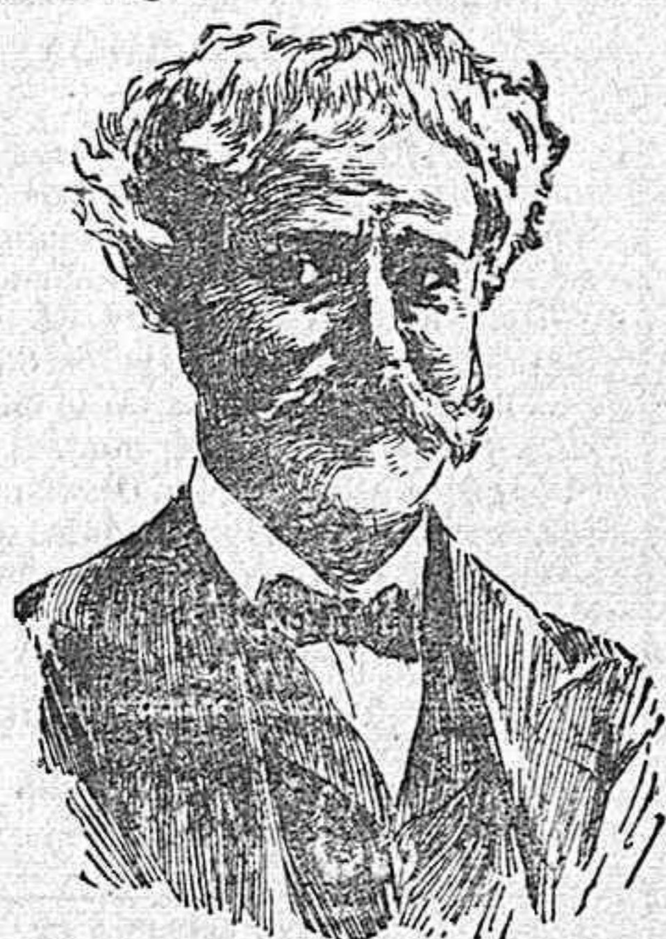
D. Pablo Sarasate.

gran altura en el parlamento español, en el que deja un vacío difícil de llenar, y otra la de un artista inimitable, gloria Europea, músico incompara-