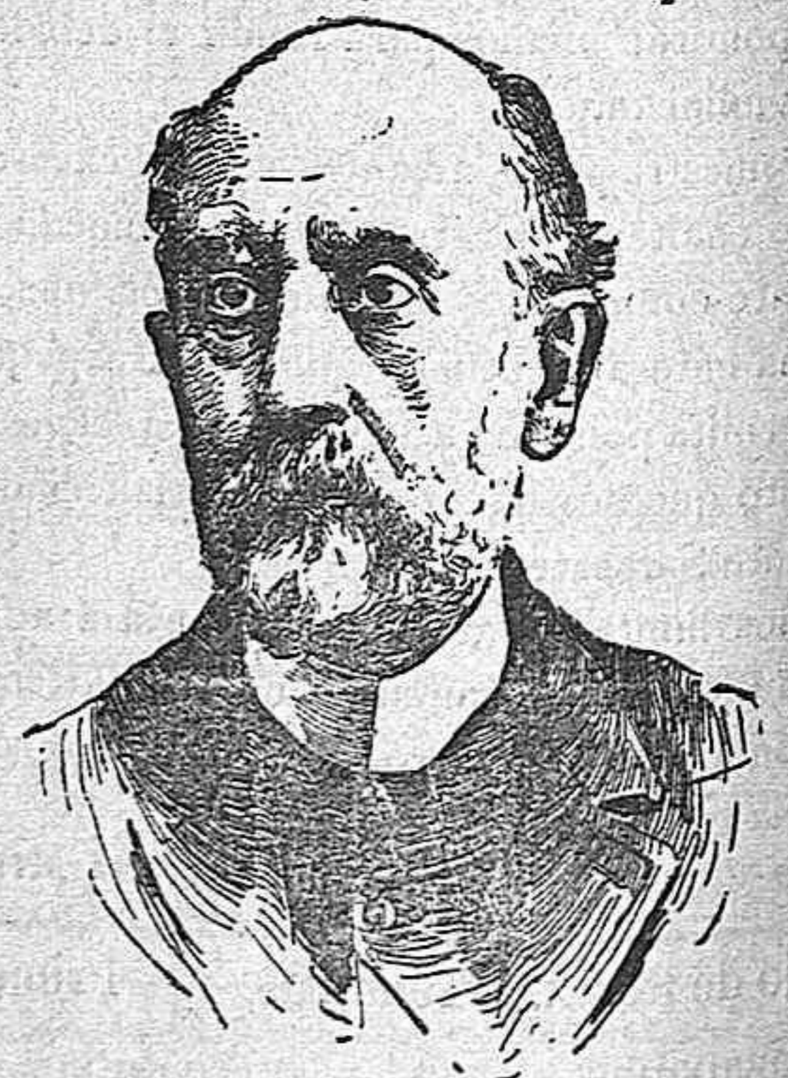
D. Nicolás Salmerón.

La pasada semana ha sido cruel con los españoles, pues arrebató á la patria dos figuras ilustres á cual más, una por su personalidad política y su