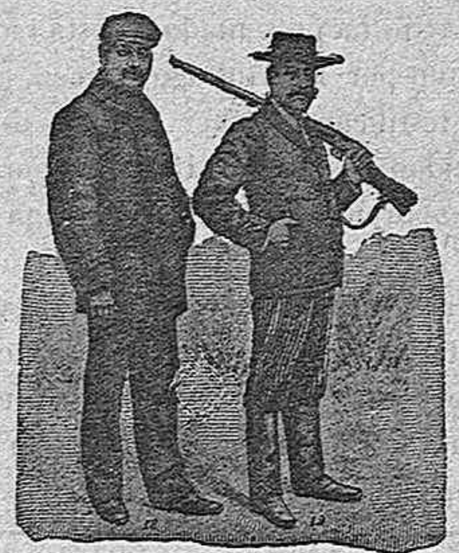
Figura 18. Chaquetón mallorquín, sin forros. En azul, café, gris claro y gris oscuro, de mucho abrigo, 30 pesetas.—Figura 19. Marsellés, cuello forma chal, adornado con paño negro, coderas y golpes de pasamanería fina. en paño azul, negro, café ó bronce, 60 pesetas.

DE NUESTRO CATALOGO DE PRENDAS DE GAZA, CAMPO Y SPORT