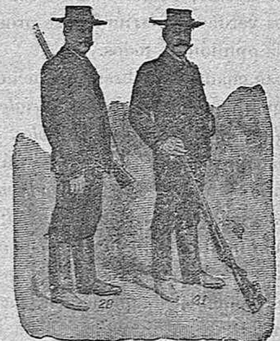
Figura 20. Chaquetón de solapas, con coderas y ribetes de elasticoin negro, en ratinas fuertes y de abrigo, en azul, negro y café, 60 pesetas.—Figura 21. Marsellés, cuello marinera, muletillas de pasamanería fina, con coderas y caídas bordadas en paño, adornado de serpentinas de seda, 75 pesetas.

Figura 18. Chaquetón mallorquín, sin forros. En azul, café, gris claro y gris oscuro, de mucho abrigo, 30 pesetas.—Figura 19. Marsellés, cuello forma chal, adornado con paño negro, coderas y golpes de pasamanería fina. en paño azul, negro, café ó bronce, 60 pesetas.