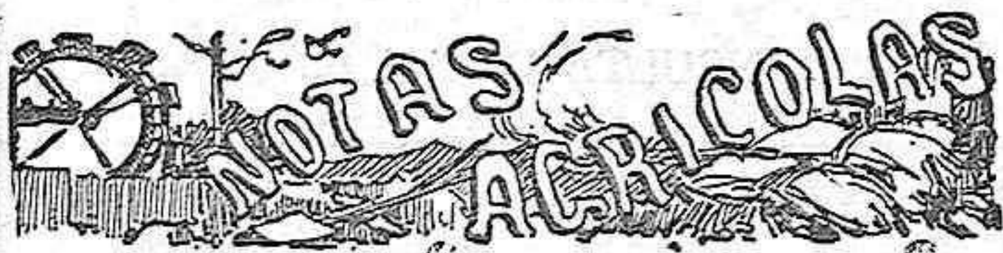
Plaga de los olivares en Mora.