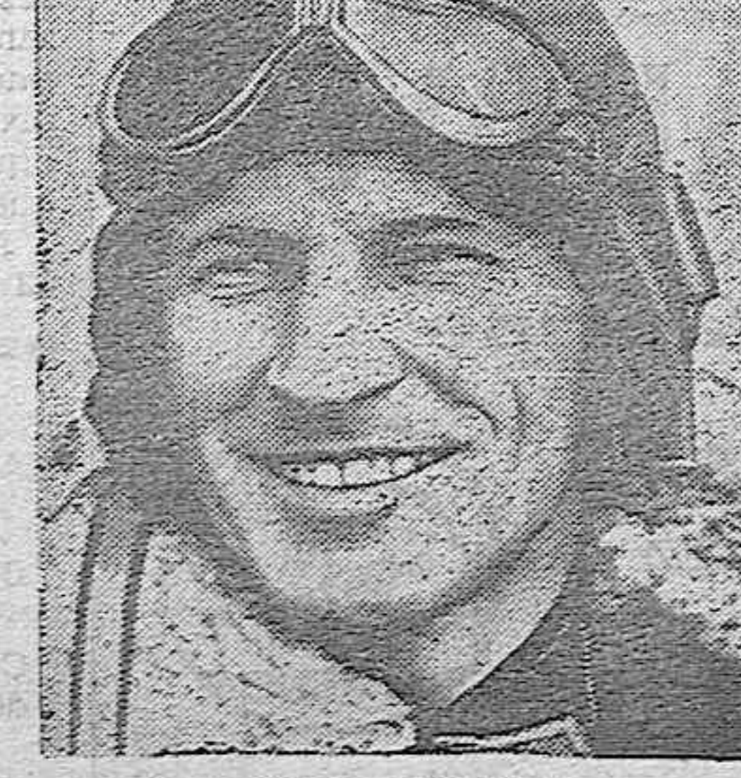
KINGSFOTTH SMITH Hización de un servicio permanente entre Europa y Australia, se efectuará hoy, domingo, y tendrán

Preparación completa por profesorado competente. Matriculadas hasta el 31 de octubre. Informes: de 3 a 6 tarde y de 9 a 11 noche.