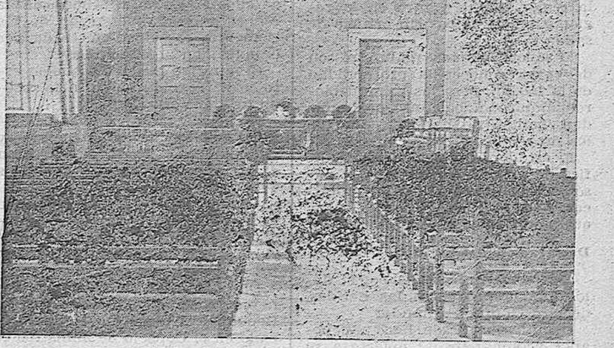
Salón de actos.

el claustro de la Escuela ha anticipado la exposición anual que an-