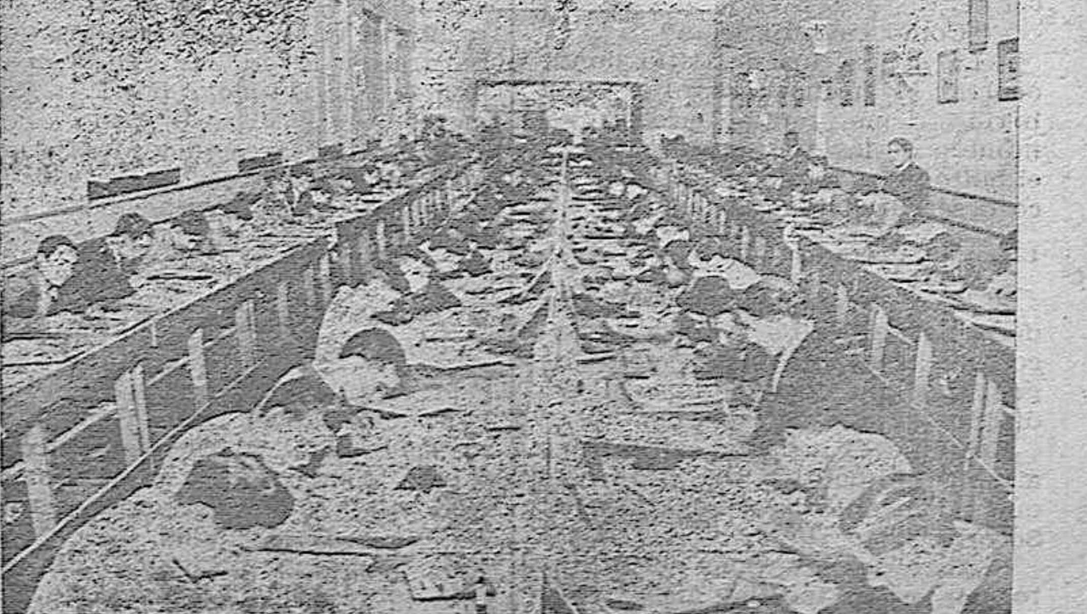
Clase de dibujo lineal.

caz, llegará a escalar las cumbres del Arte.