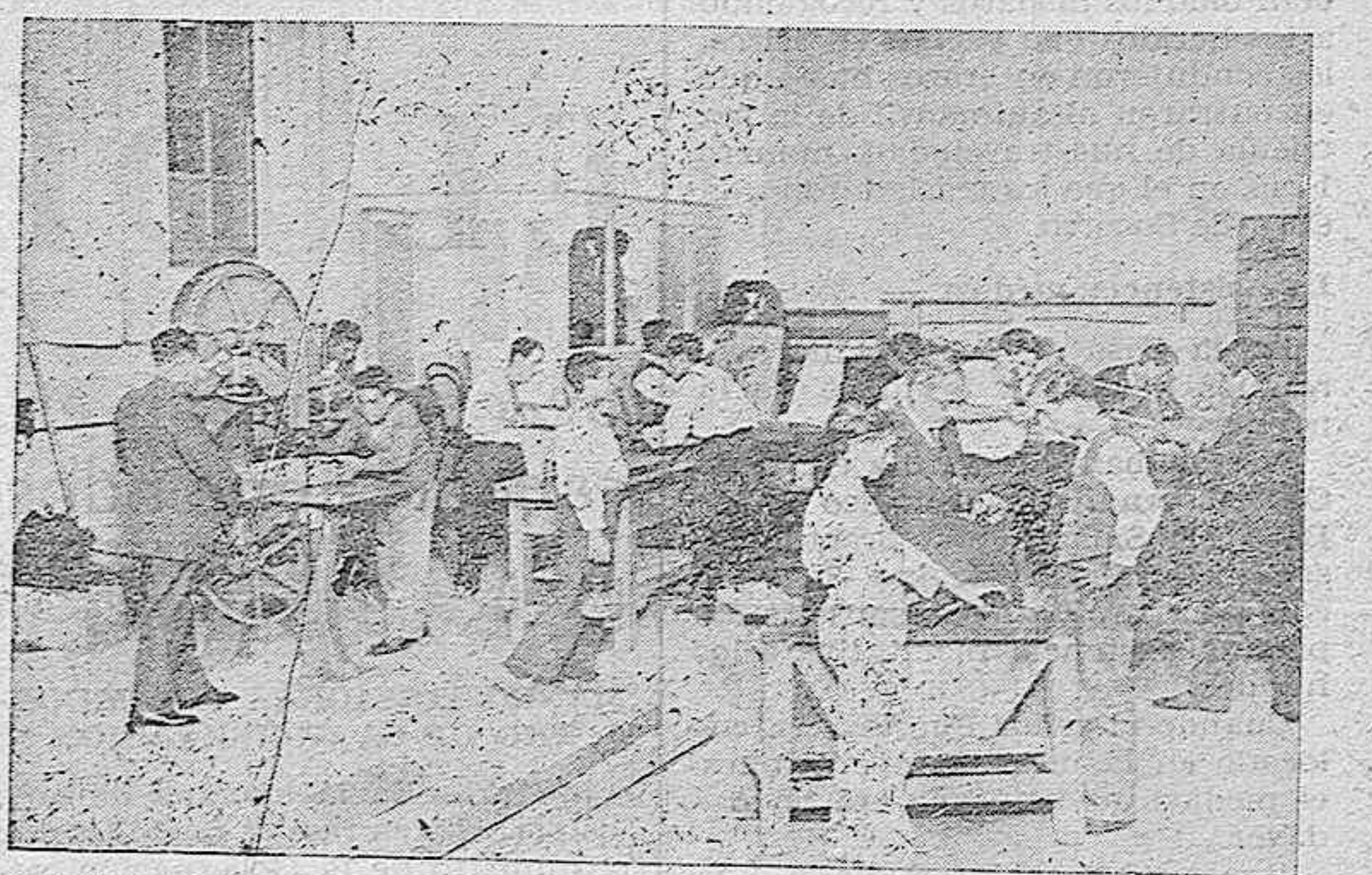
TALLER DE TALLA DE MADERA. — Ebanistería, pirograbado y carpintería.

de todos los buenos almerienses. Este año y para que coincida con nuestras fiestas del mes de Agosto,