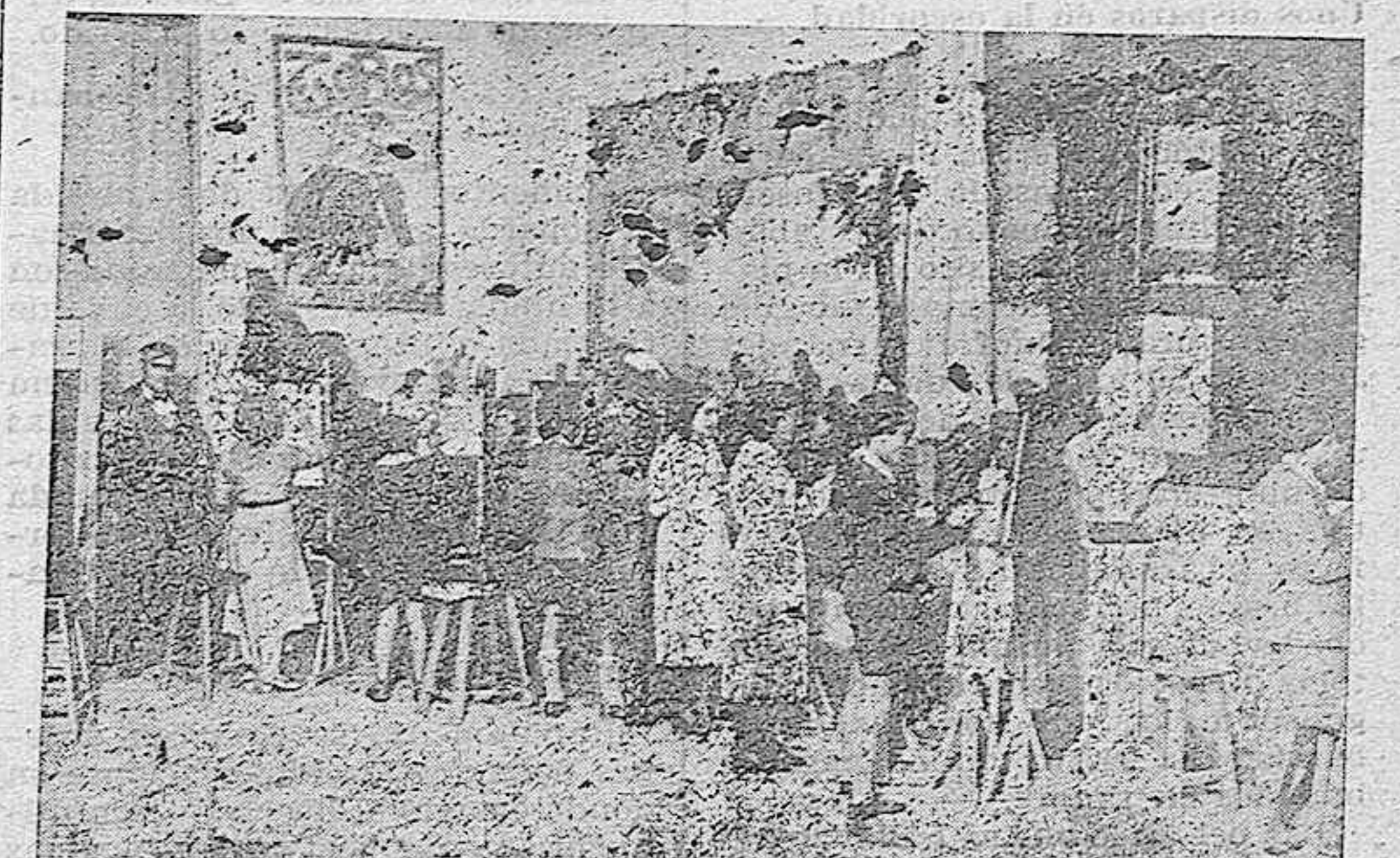
COMPOSICION DECORATIVA. — Pintura.

Escuela de Artes y Oficios, será con el tiempo un centro a donde vengán a estudiar la más remota antigüedad, los hombres más eminentes de Europa y América. Ap-