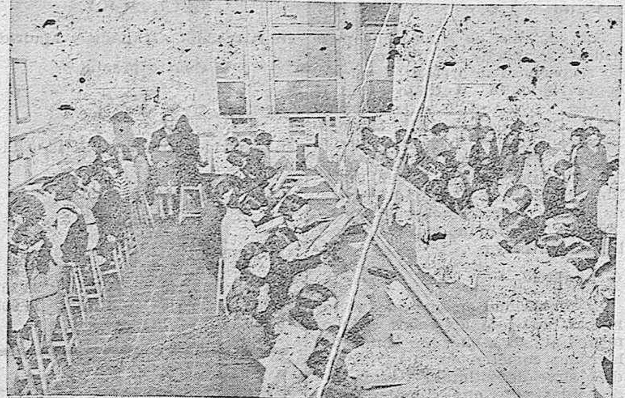
DIBUJO ARTISTICO. — Sección de señoritas.

III Almería puede hoy envejecerse de mostrar a la curiosidad del forastero un soberbio palacio dedicado exclusivamente a la enseñanza