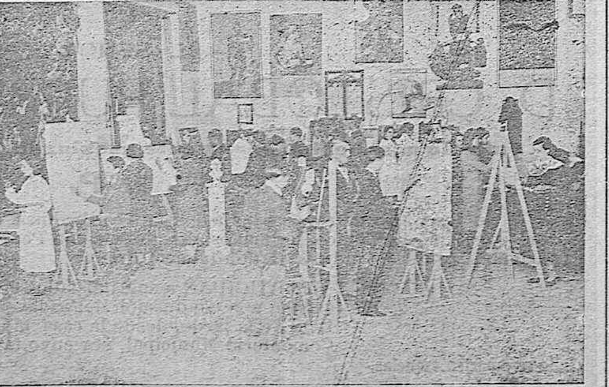
COMPOSICION DECORATIVA. — Pintura.

de trabajadores manuales con una verdadera pléya de obreros artísticos