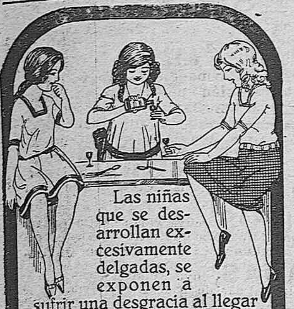
Las niñas que se desarrollan excesivamente delgadas, se exponen a sufrir una desgracia al llegar a la época de su transformación o cuando menos a quedar enfermizas e inútiles para toda su vida.

Hay concedidas indulgencias en la forma acostumbrada.