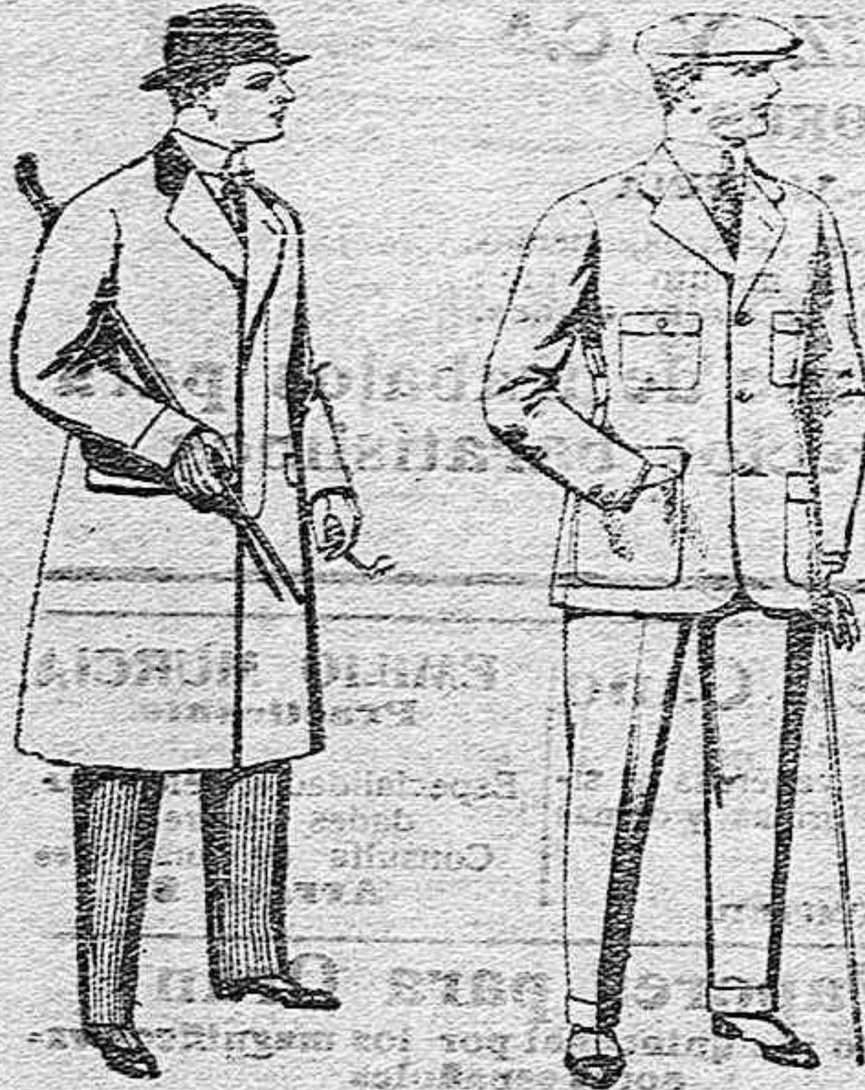
Gabanes de paten, melton y cheviot, con forros seda, saten o escocés, de pesetas 33 a 100.