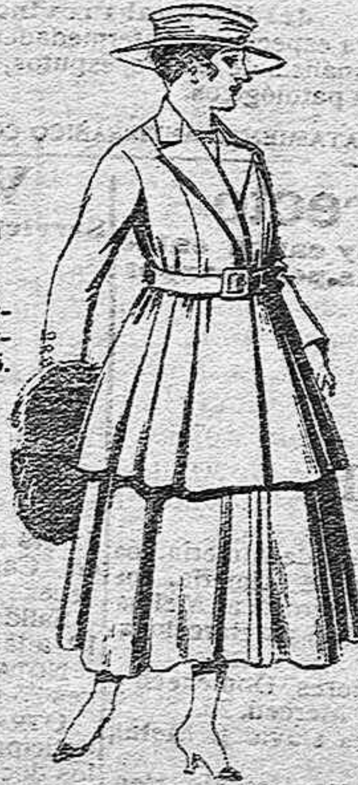
Traje de lana para señora, en color negro y azul, de pesetas 85 a 100.