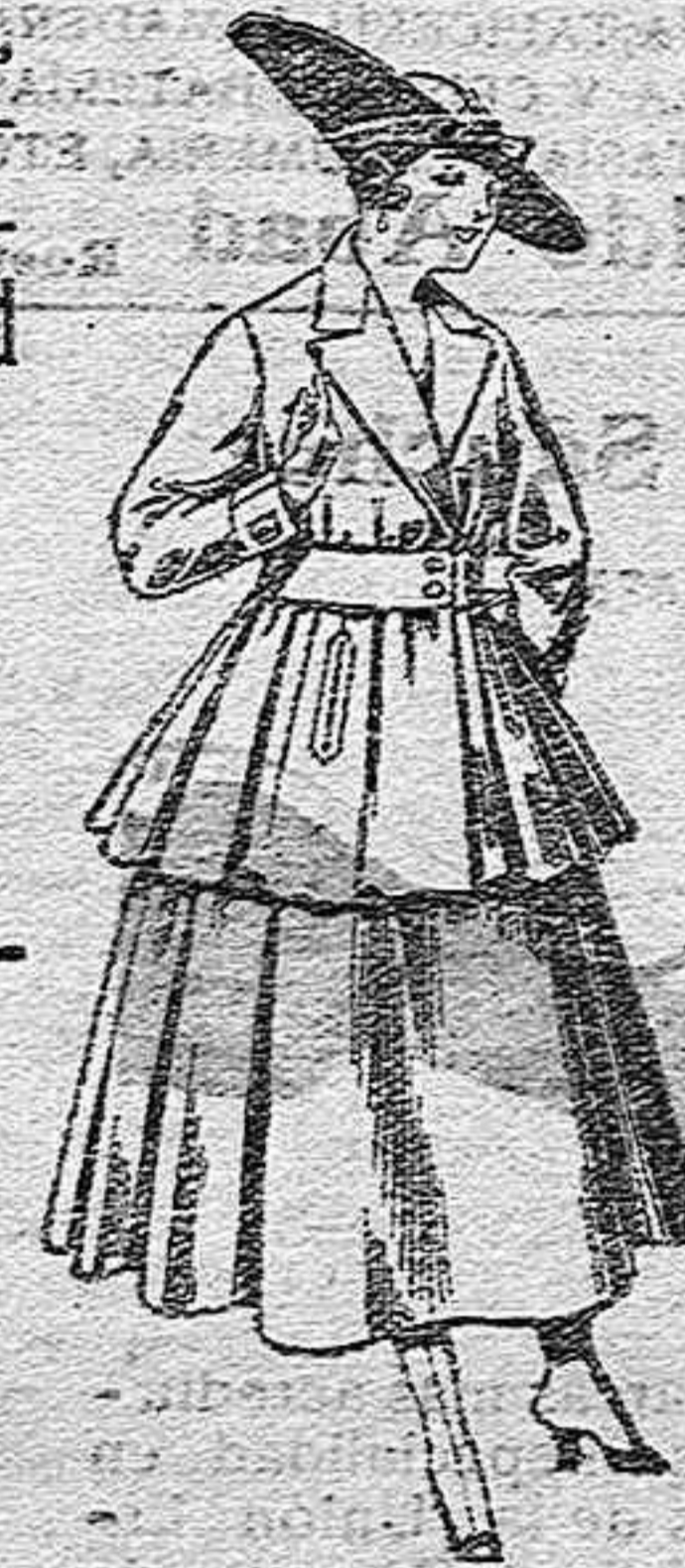
Traje de lana, en negro, azul y color, para señora, de pesetas 90 a 100.