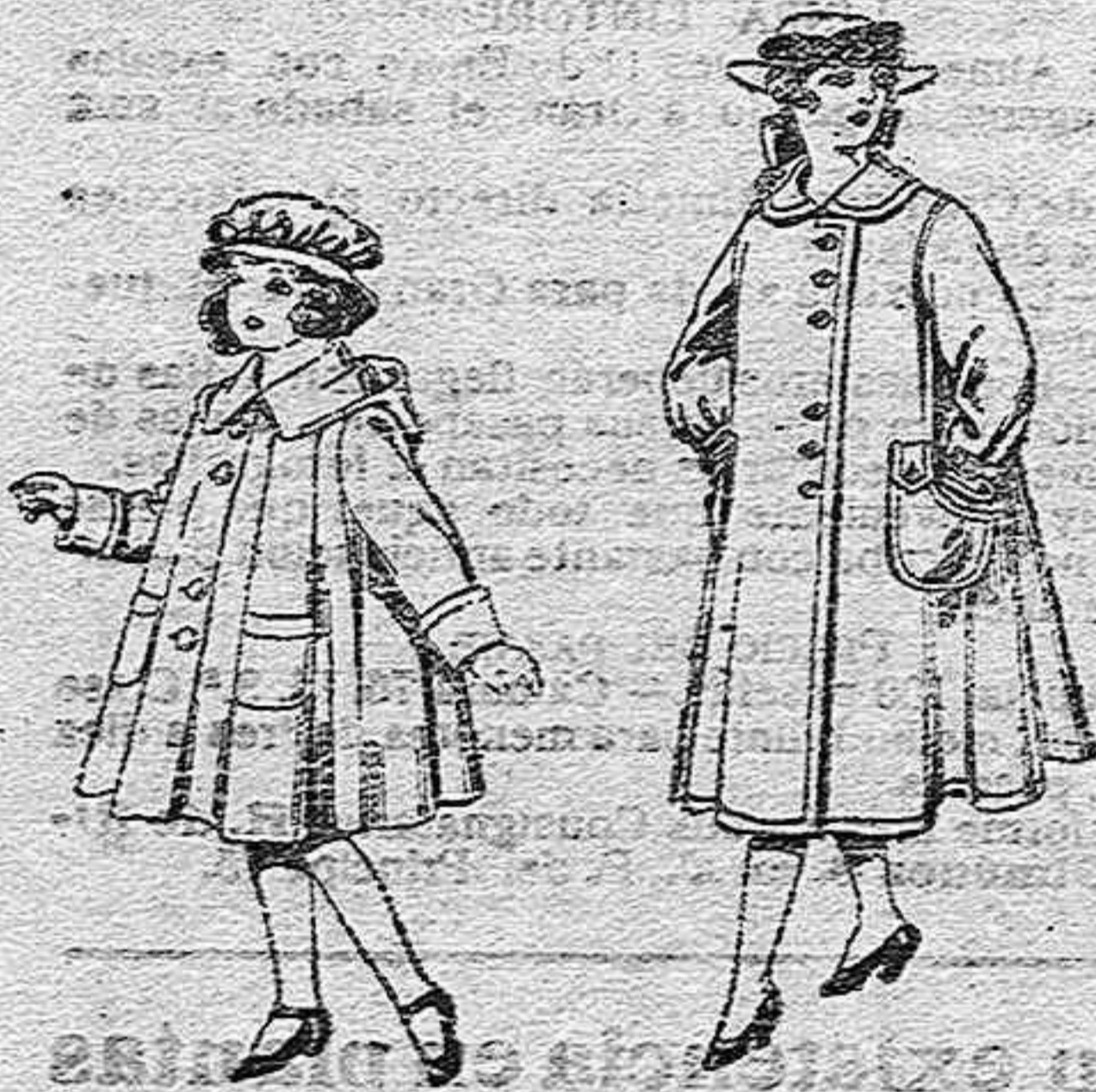
Abrigos de paten, para niñas de 4 a 9 años, de pesetas 22 a 33.