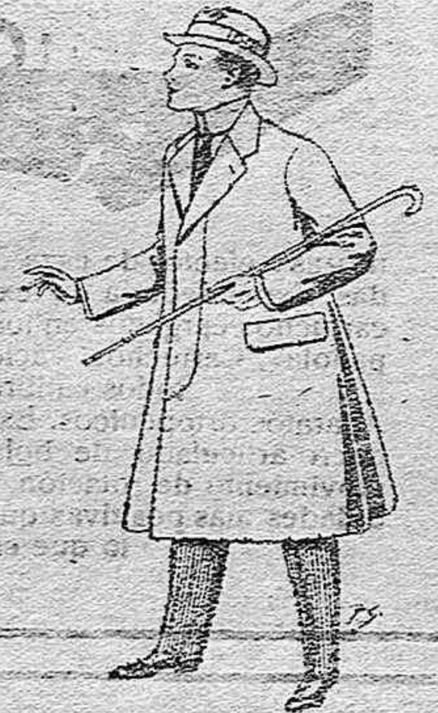
Gabanes de lana, vigonía o melton, con forros saten o seda, para niños de 10 a 12 años, de pesetas 20 a 53.