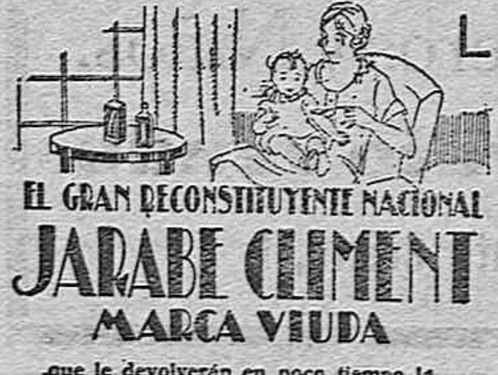
EL GRAN RECONSTITUYENTE NACIONAL JARABE CLEMENT MARCA VIUDA