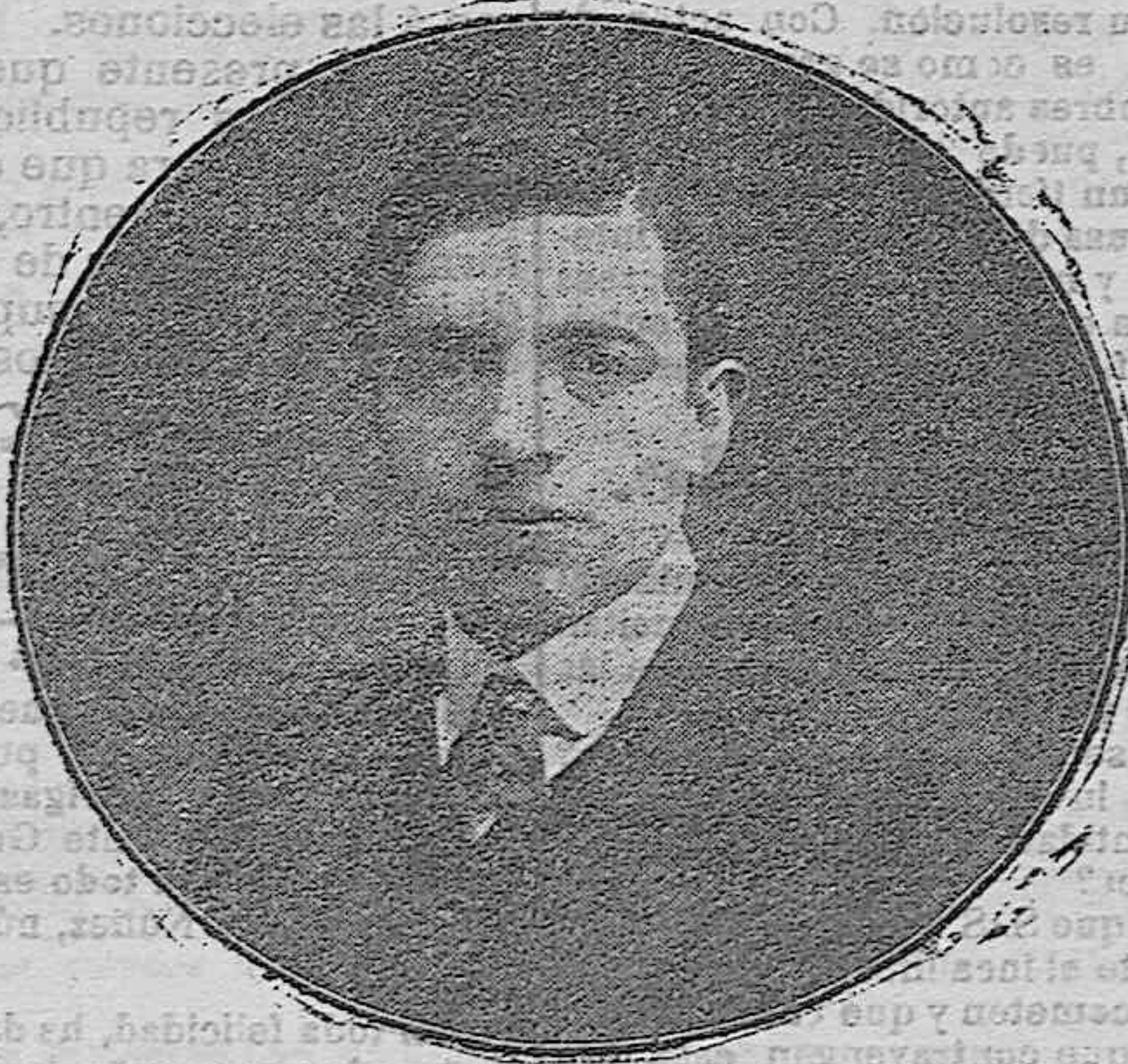
Paco Villaespesa: Glorioso autor de "El Alcázar de las Perlas".

La cariñosa acogida del poeta y las bondades que María Guerrero y Mendoza han prodigado a EL RADICAL, nos han proporcionado el placer y el honor de presenciar el último ensayo de El Alcázar de las Perlas.