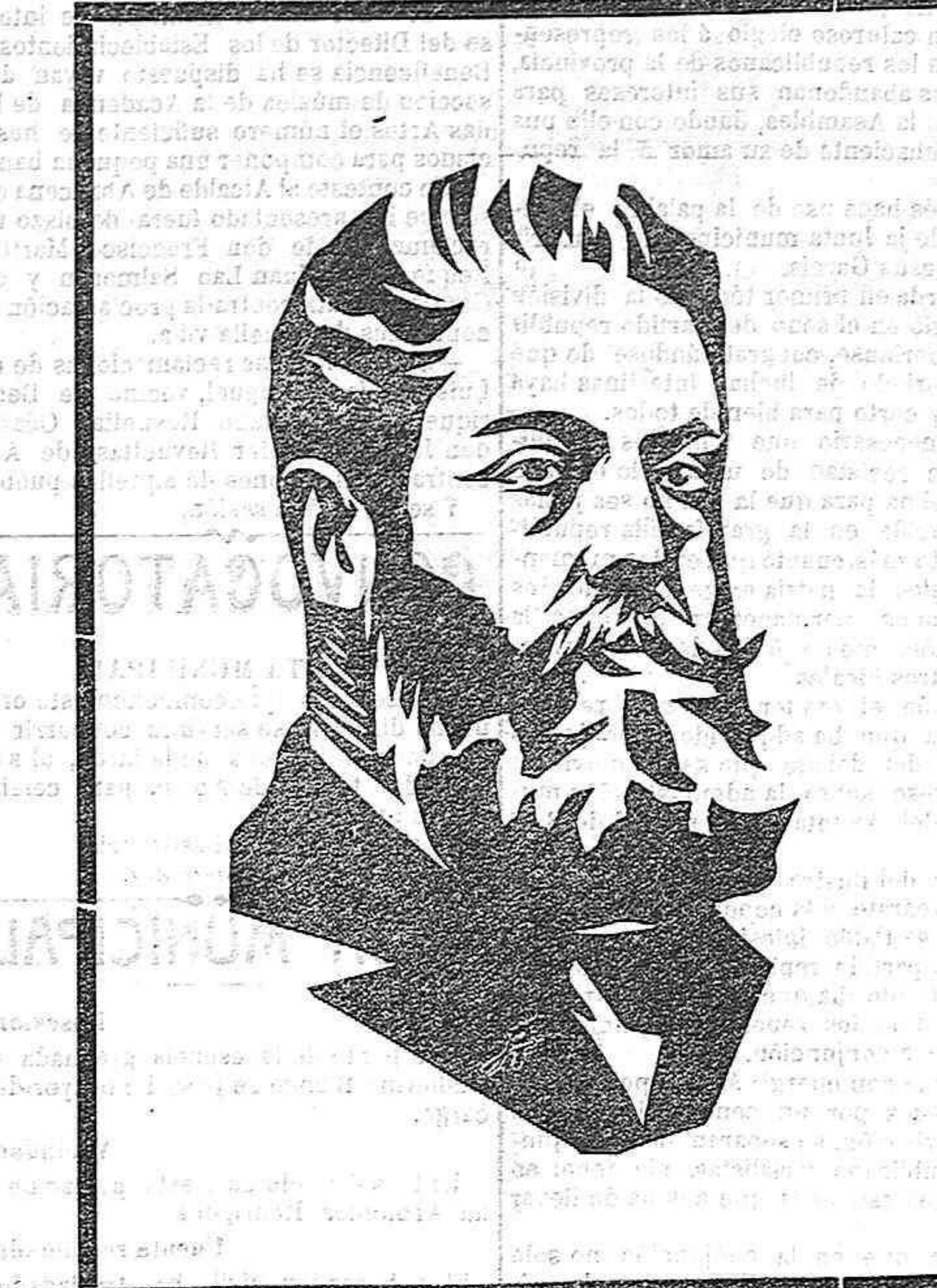
Costa, el coloso de la idea, representó en España la voz de la naturaleza, de la humanidad, del progreso, de la civilización, de la razón y de la justicia.