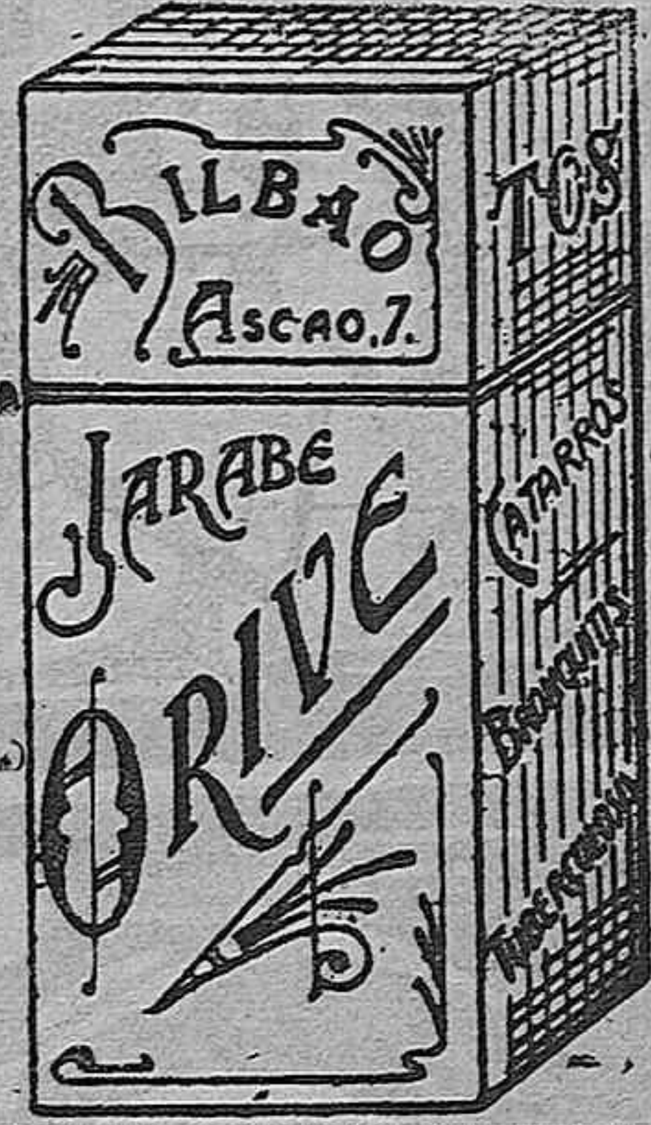
EL MEJOR remedio para el PEOR catarro Jarabe Orive. Precio 4'25 Ptas.

Vapor norteamericano «West Hotamah» para New Orleans, con mineral. — Idem sueco «Varing», para Londres, con frutas. — Idem español «Infanta Isabel de Borbón», para Málaga, con 94 pasajeros y 298 en tránsito. — Idem idem «Mariano Cano», para Melilla, con carga general y pasajeros. — Idem idem «Roberto R.», para Aguilas, con carga general. — Idem idem «Cabo La Plata», para Aguilas, con carga general. — Idem «Cabo Torriñana», para Melilla, con carga general y pasajeros. — Laud «Salvador Románach», para Barcelona, con pescado fresco.