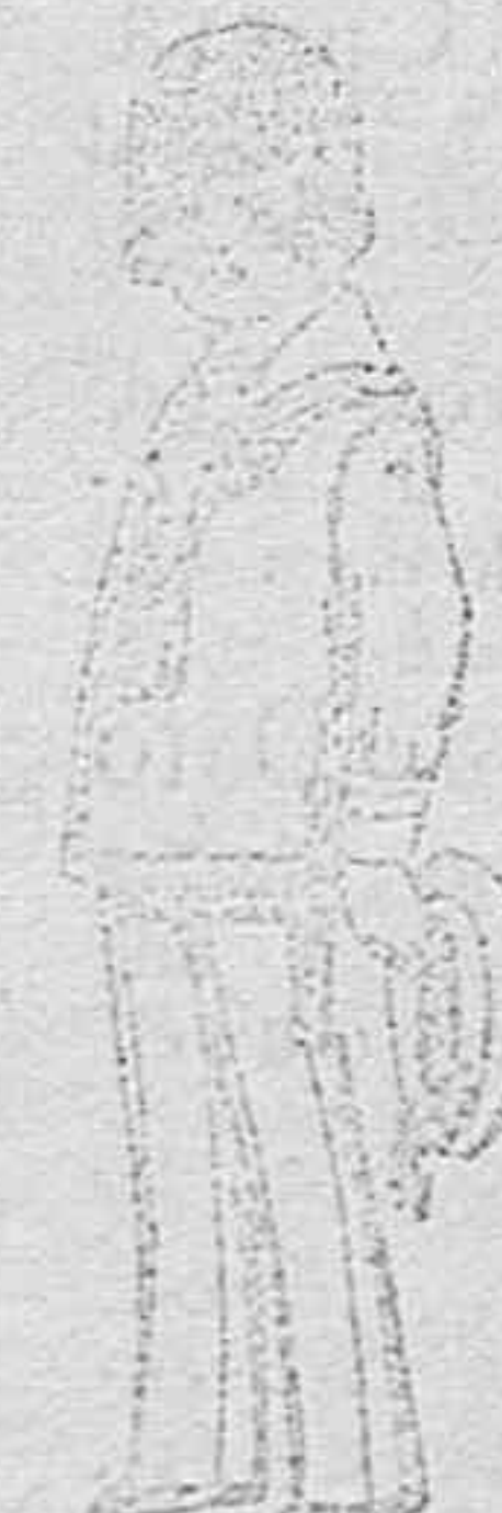
Trajes modelo «Marinera inglesa», de vicuña o estambre azul y negro para niños de 3 a 9 años de ptas. 26 a 45.

Camisería, Géneros de punto, Corbatería, Guantería, Sombrerería, Zapatería, Paraguas, Bastones y Artículos de Viaje.