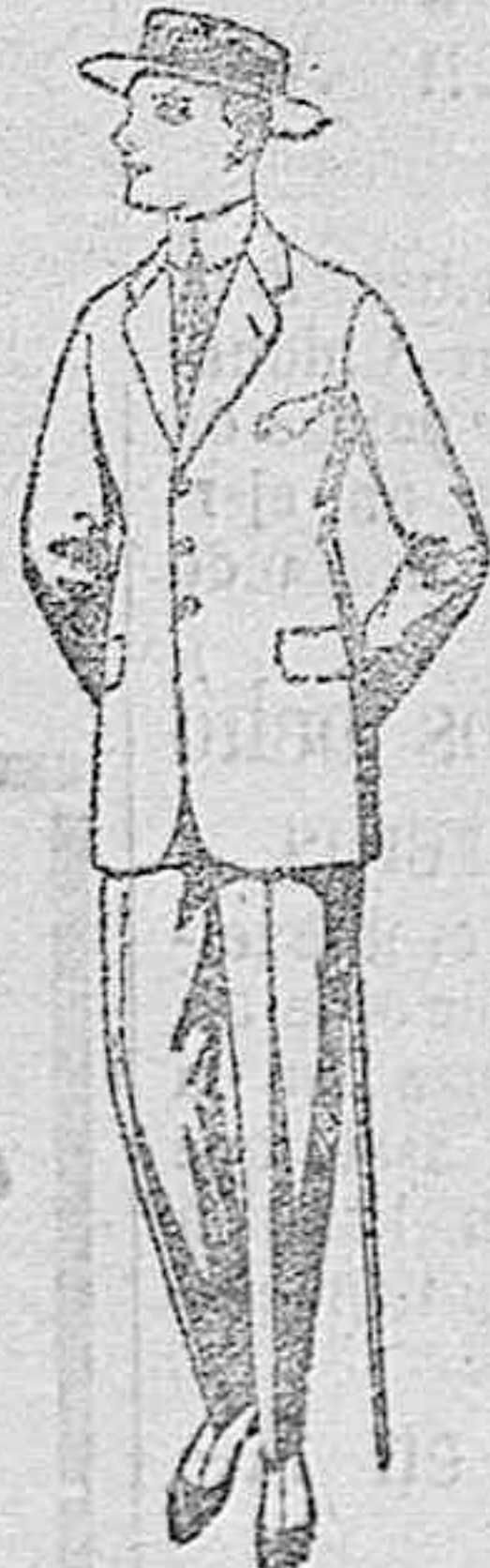
Trajes de lanilla, melton, vicuña, etc., para jóvenes de 10 a 16 años, de ptas. 25 a 65.