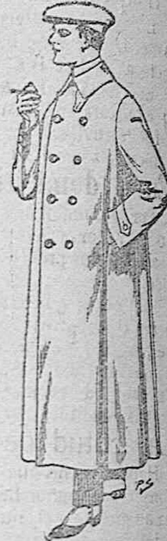
Guarda-olivos de dril o algodón de ptas. 25 a 45