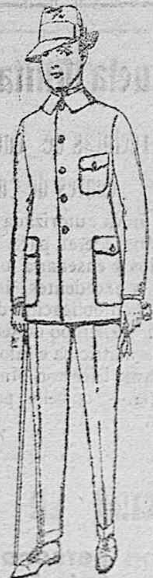
Guerreras de dril crudo kaki o blanco de ptas. 7'50 a 15. Pantalones de dril crudo kaki o blanco de ptas. 8 a 14.