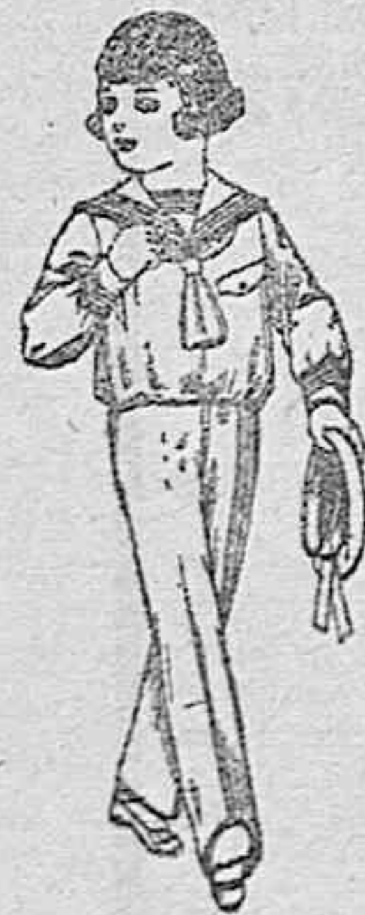
Trajes modelo «Marinera», de dril o algodón blanco para niños de 3 a 9 años, de ptas. 14 a 22.

Ropas confeccionadas para Caballero, Señora, Niño y Niña.