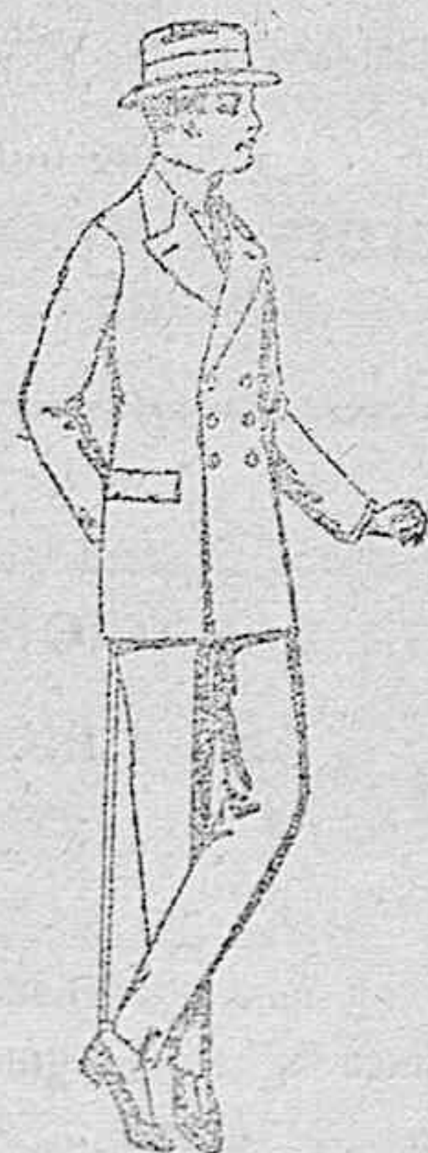
Trajes de lanilla, vicuña o estambre para jóvenes de 10 a 16 años, de ptas. 30 a 80.