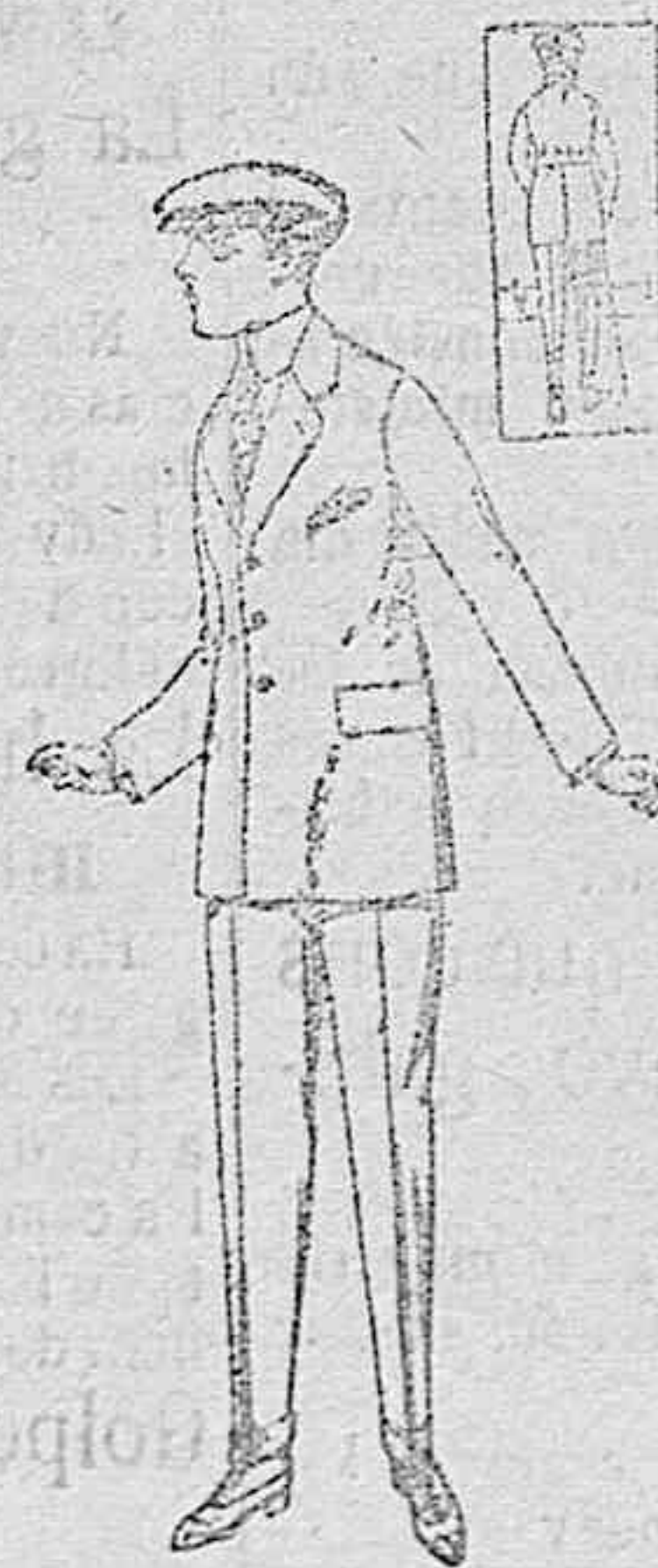
Trajes modelo «Sport», de lanilla, melton, e c., para jóvenes de 10 a 16, de ptas. 32 a 60.