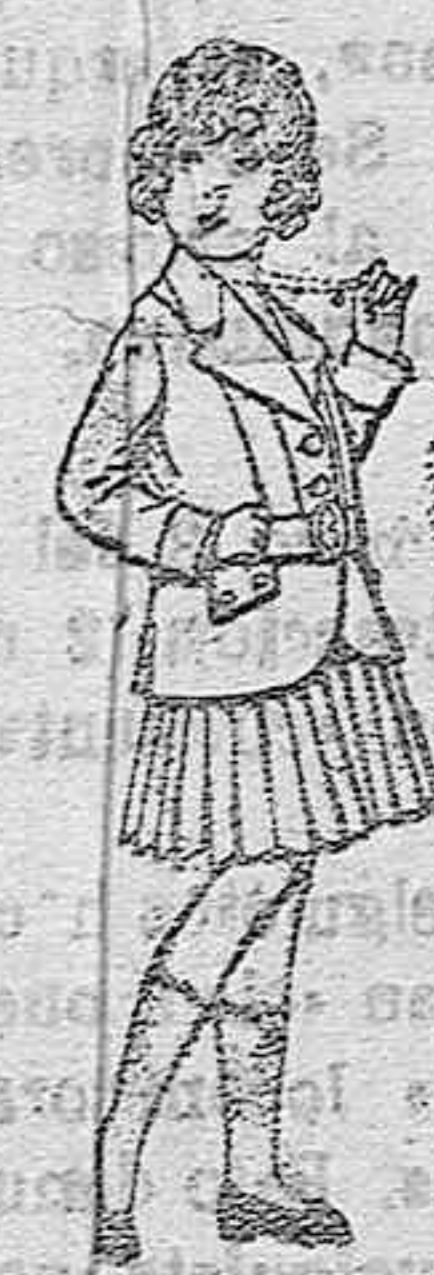
Trajes de lana para niñas de 4 á 12 años. De pesetas 20 á 35