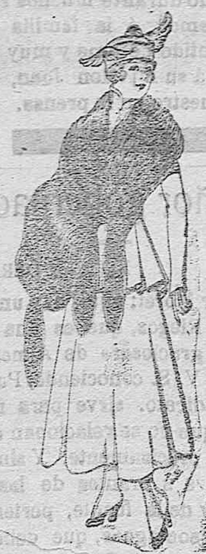
Juego de pieles imitación perfecta al renacuajo negro. De pts. 40 á 40