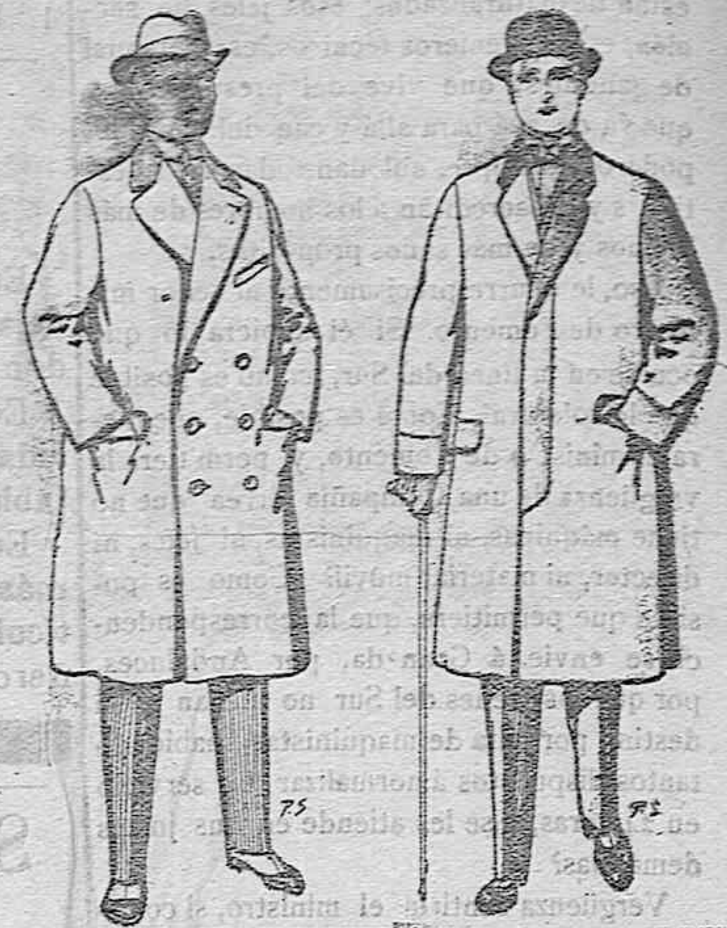
Cabanes de patén cheviot etc. De pesetas 55 á 105. Cabanes de patén, melton y cheviot. De pesetas 25 á 100