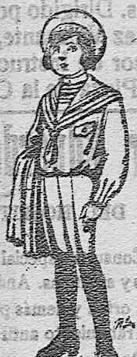
Trajes de jergal negra ó azul para niños de 4 á 9 años. De ptas. 5 á 10.