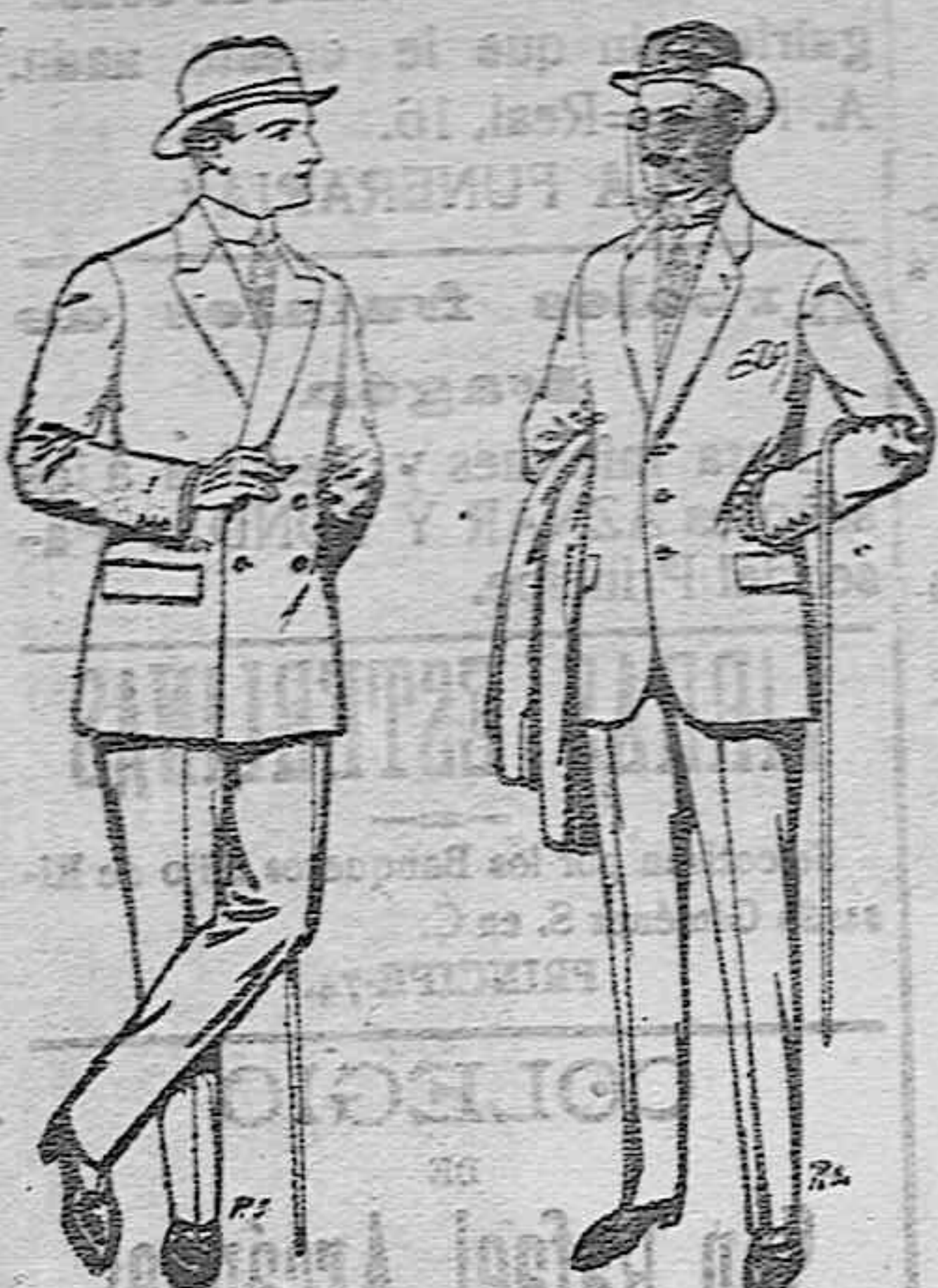
Trajes de cheviot patén, etc. De pesetas 27 á 35. Trajes de patén cheviot etcétera. De pesetas 17'50 á 30