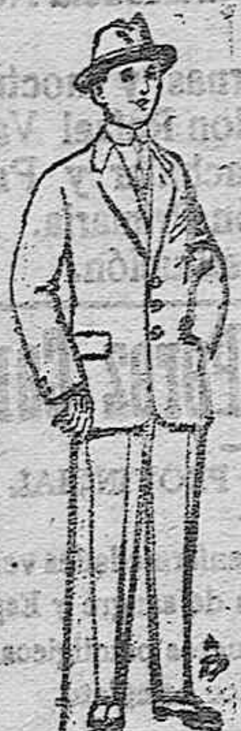
Trajes de patén vicuña ó jerga para niños de 10 á 16 años. De ptas. 14 á 50