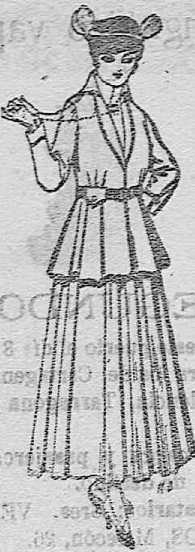
Trajes de lana negra, azul y de color, para señora. A pesetas 35,