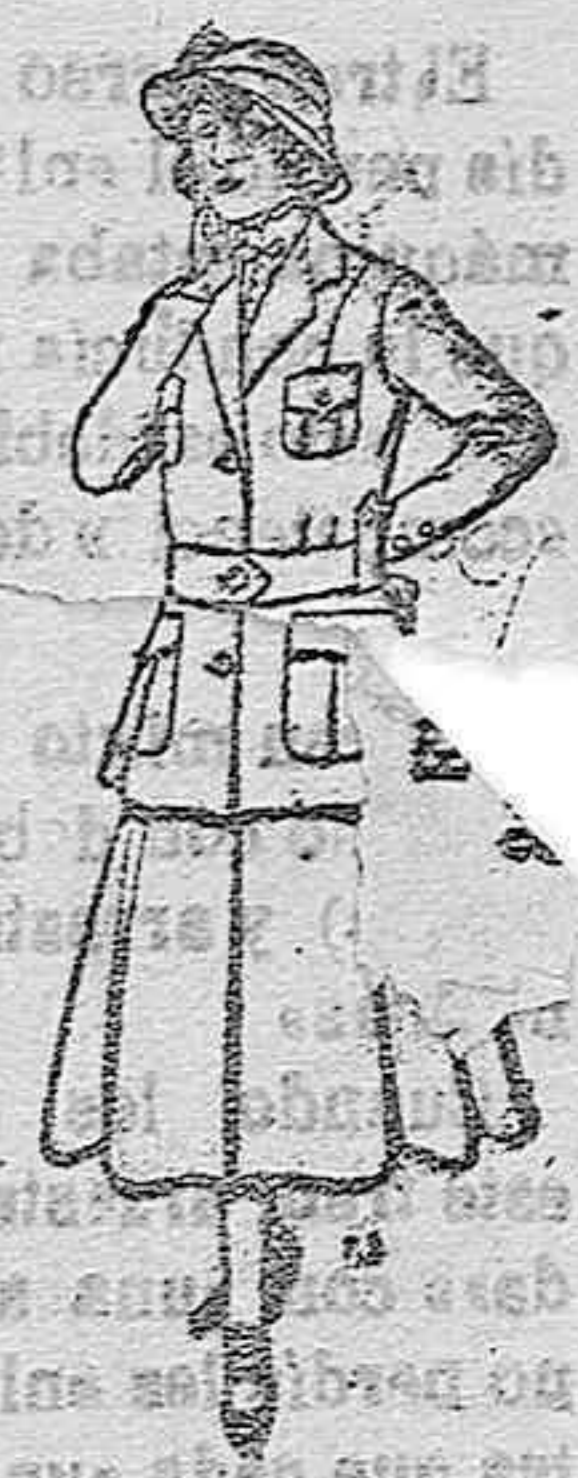
Trajes de lana para jovencitas de 13 á 16 años. De pesetas 40 á 45