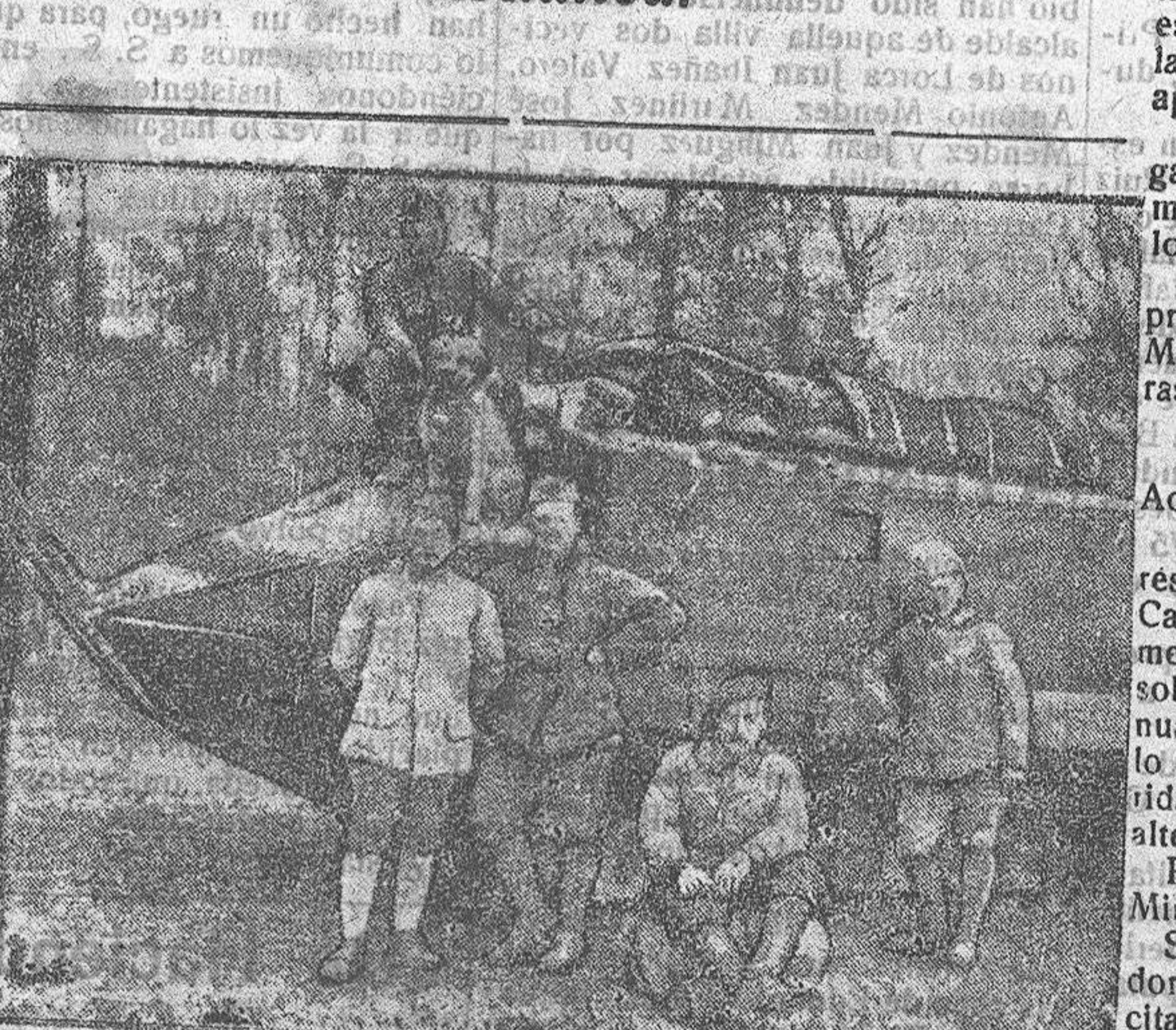
UN TANKE INGLÉS Y SU DOTACIÓN

Hoy, a las dos de la tarde, en el tinglado número 5 del muelle de Levante, se le da al señor Polo de Lara el banquete popular con que la ciudad de Almería le manifiesta su leal gratitud por su corta pero honrada labor gubernativa.