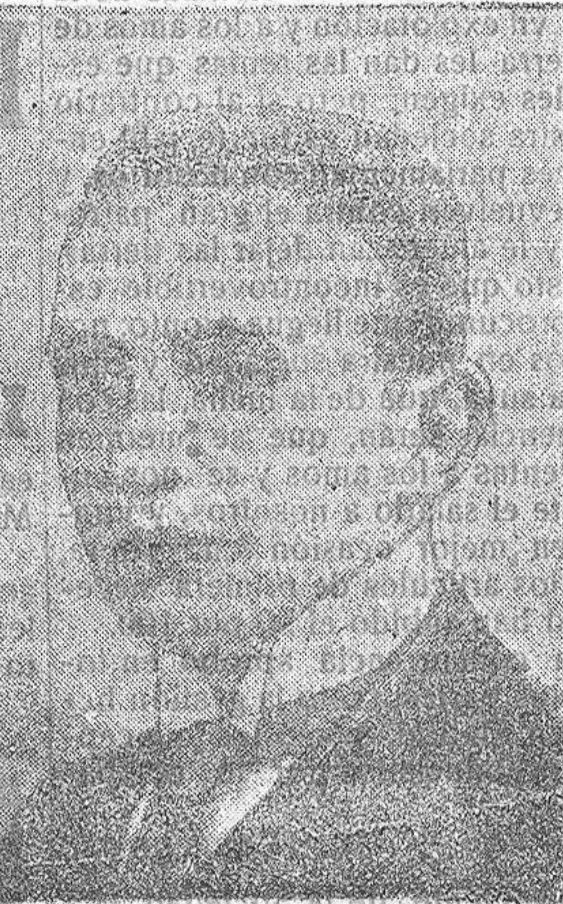
M. TERETCHENKO Ministro de Estado de Rusia.

Creemos que bastará con que el señor gobernador conozca que en Gérgal hay un mal alcalde. Para curar a estos señores es el señor Polo de Lara un doctor excelentísimo. A probárnoslo.