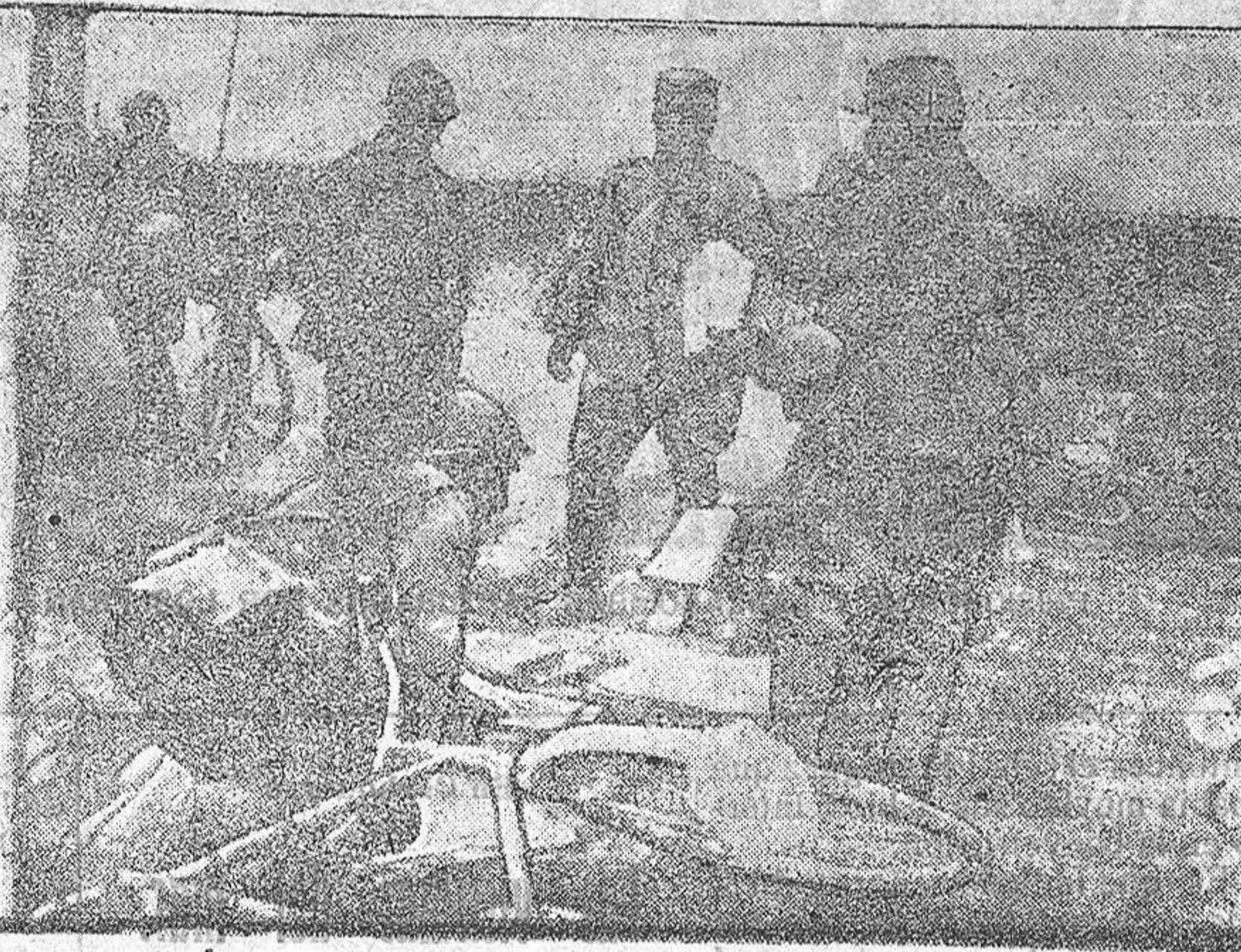
DISTRIBUCIÓN DE PERIÓDICOS EN EL CAMPAMENTO

Y nos dicen los labradores. Hemos querido hablar con el gobernador para exponerle todas estas cosas y no nos ha sido posible, ¿qué hacemos? Conformarnos no; ahora vamos al pueblo y al decir a los pequeños labradores que el fruto que les costó tantos afanes se pudrirá allí, mientras faltan patatas en Melilla y en otras poblaciones, que la única cosa que podría atenuar un poco la miseria del pueblo no se puede hacer porque nos la prohíben, el pueblo que no sabe de leyes de subsistencias, que está en un caso quizás único, que no pudo indignarse contra el hielo, ni contra el mar, ni contra el río, se indignará contra el gobernador, que no se interesa por nosotros