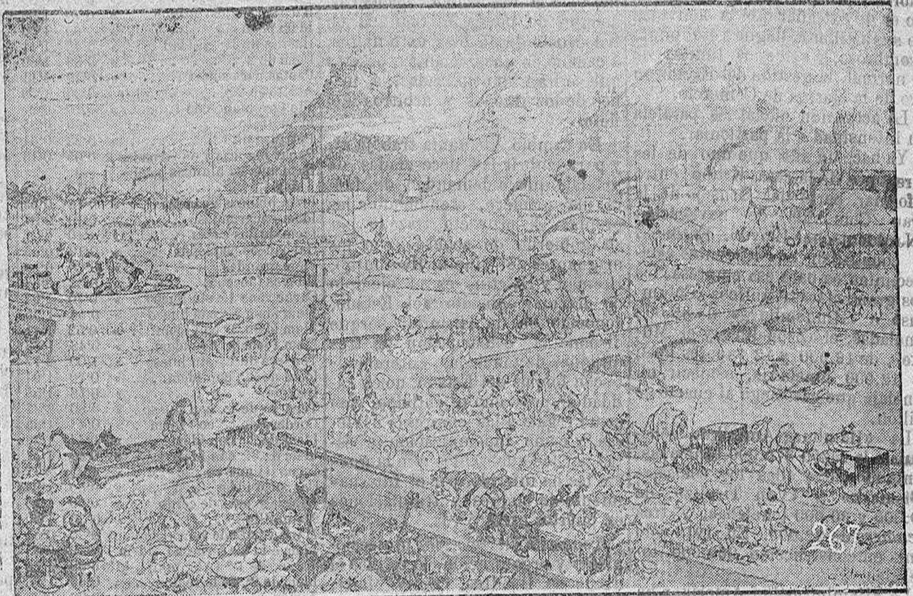
Delicioso aspecto de la vida en Egipto, cuando losalemanes logren libertarlo de la prestón inglesa

mentos de cargas y otras zarandajas, donde el mundo de la aventura chapotea y se enfanga.