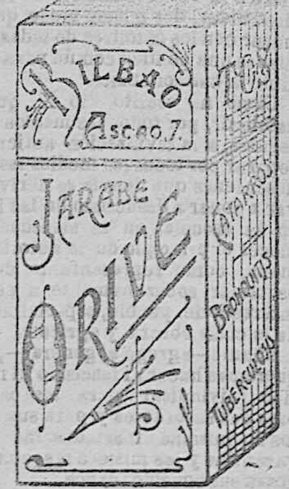
El MEJOR remedio para el PEOR catarro, Jarabe Orive. Precio 4'25 Ptas.