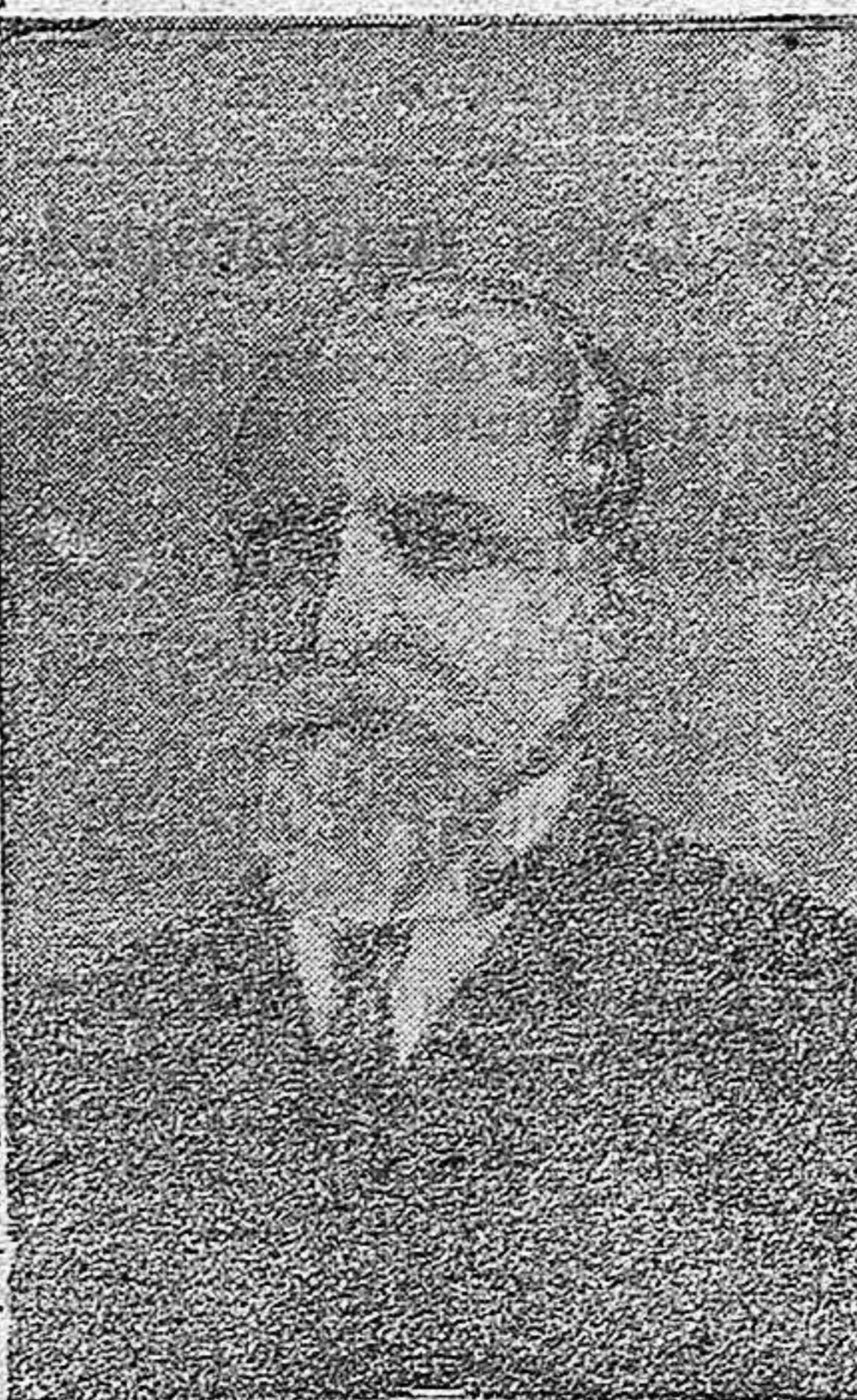
EL GENERAL CURRIE Generalísimo de las tropas canadienses

Nosotros sabemos nuestro deber y lo cumpliremos cuando la ocasión llegue. Pero la ocasión tenemos que verla nosotros. Mientras tanto, que sigan los demás con su labor. Nosotros tenemos nuestra conciencia tranquila y vamos serenamente al porvenir, sin desmayos, pero sin impacencias.